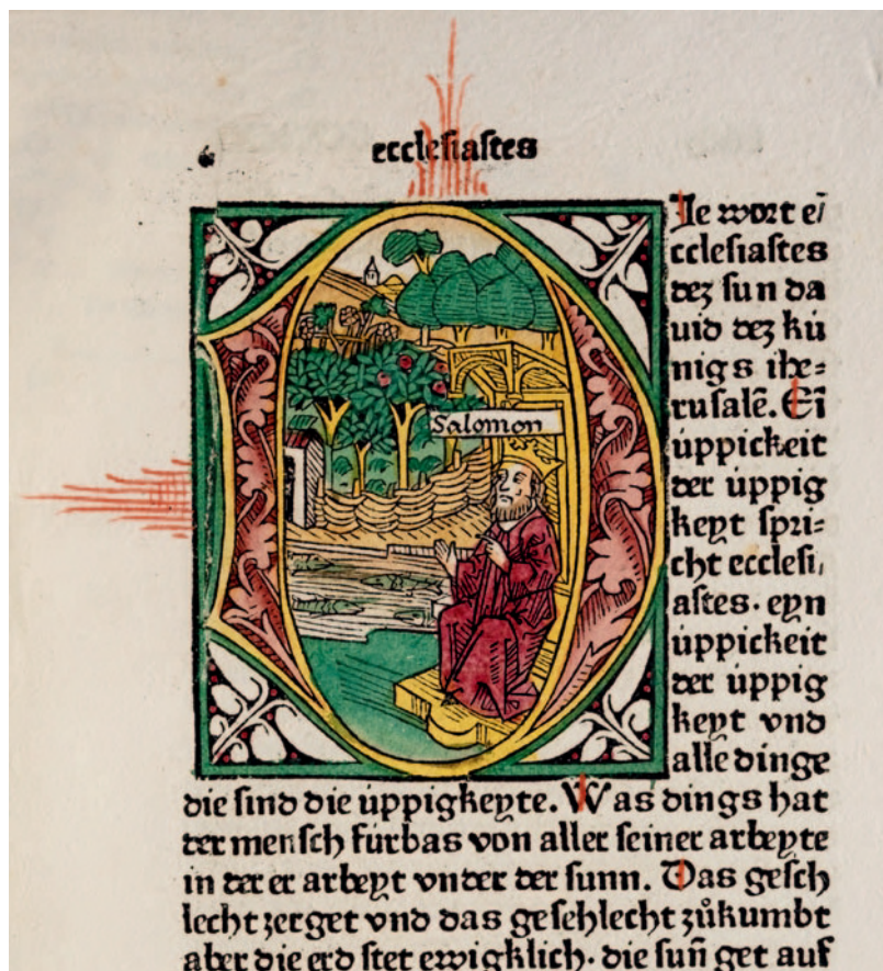
Abb. 1.2.2a: D 4-1, fol. 271 r : Beginn des Buches Kohelet