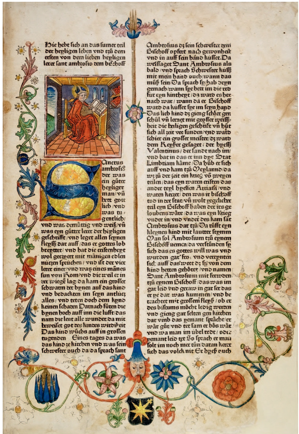
Abb. 1.2.3a: C 14-2, fol. 2 r : Der Kirchenvater Ambrosius am Schreibpult