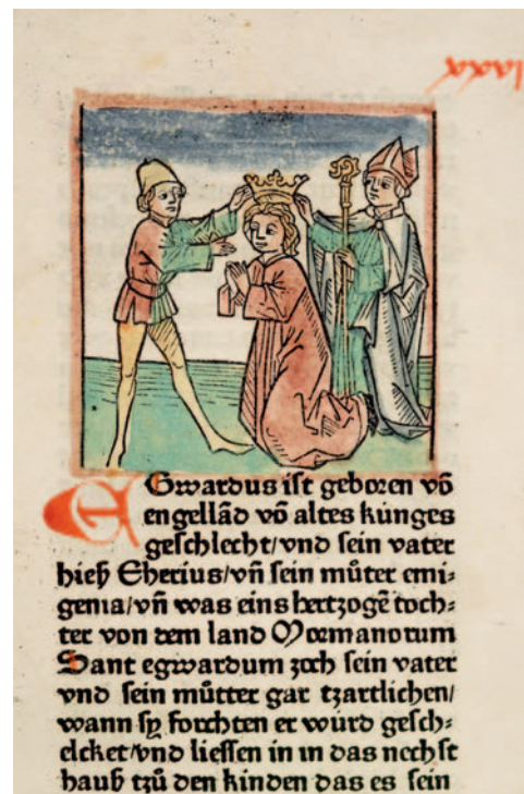
Abb. 1.2.3c: C-14-1, fol. 26 ra : Edward der Bekenner wird zum König von England gekrönt (1043).

Der Holzschnitt zeigt Bischof Ambrosius von Mailand, einen Kirchenlehrer der Spätantike, der die Reihe der Heiligenviten eröffnet. Er