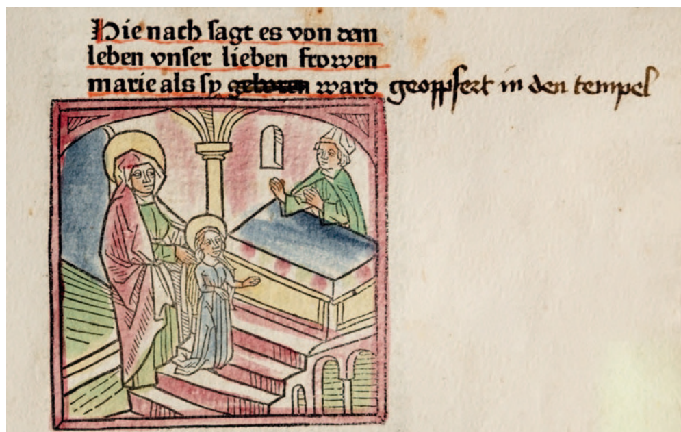
Abb. 1.2.3b: C 14-1, fol. 77 rb : Mariä Opferung im Tempel

sitzt am Schreibpult und verfasst eine Schrift. Im Regal hinter dem Schreibpult werden, wie im Mittelalter üblich, Bücher liegend aufbewahrt. Zum Fest Mariä Opferung im Tempel (21. November) hat ein aufmerksamer Leser die Bildüberschrift „[...] von dem leben unser frowen marie als sy geboren ward“ handschriftlich korrigiert in „[...] als sy ward geopfert in den tempel“ – und er hat recht!