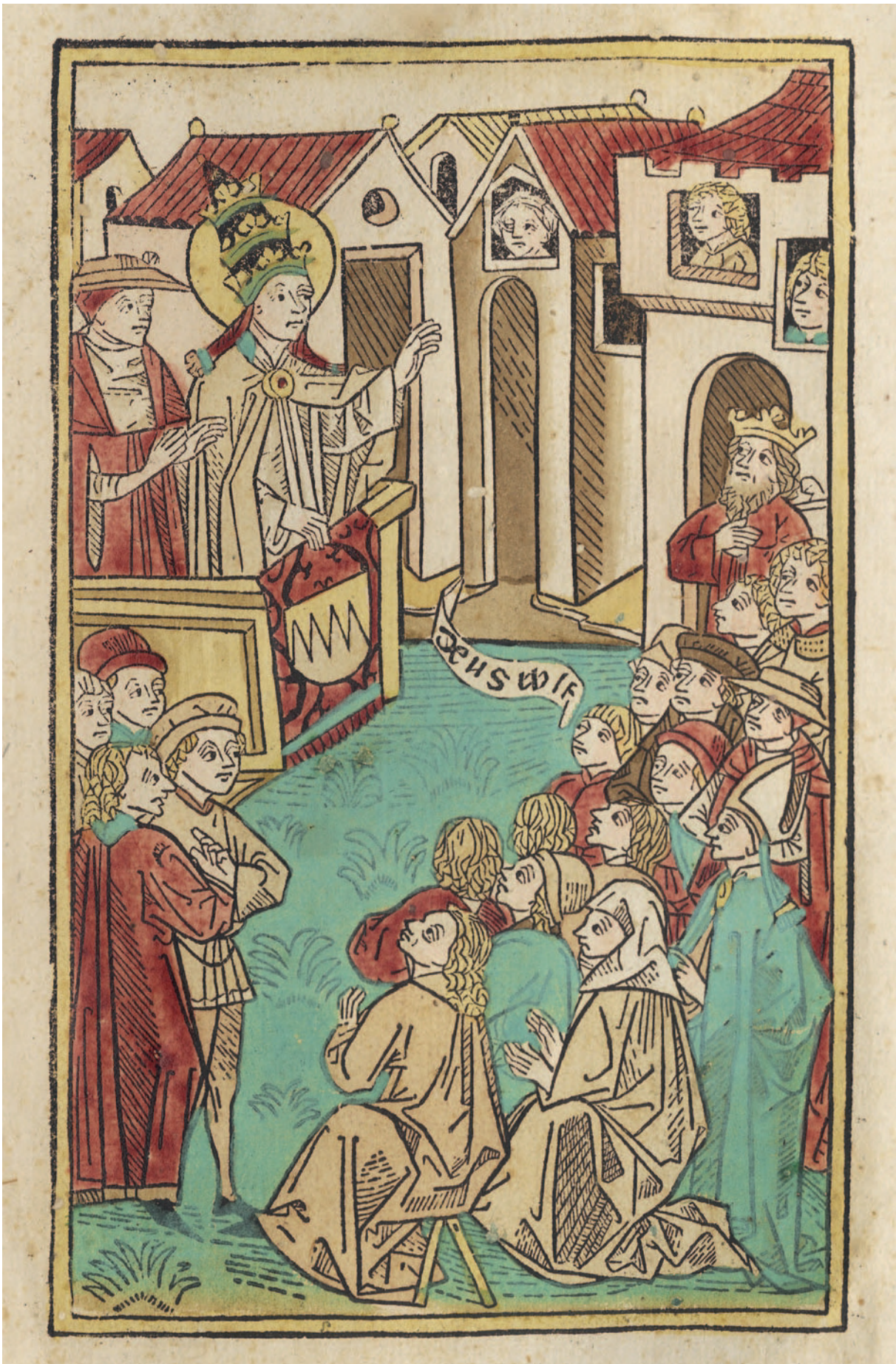
Abb.1.2.4: Papst Urban II. verkündet den Kreuzzug (Titelholzschnitt)