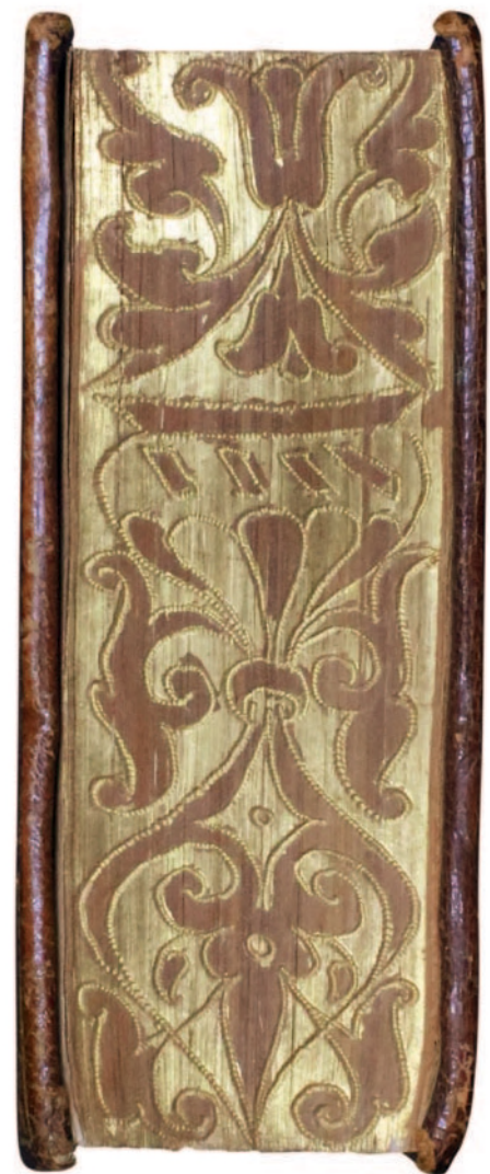
Abb. 1.3.8a und 1.3.8b