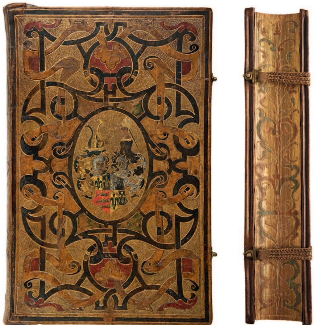
Abb. 1.3.1a und 1.3.1b

L. FLETCHER 1999, S. 78f. Nr. 28; NEEDHAM 1979, Nr. 63; HOBSON 1992, S. 172–213.