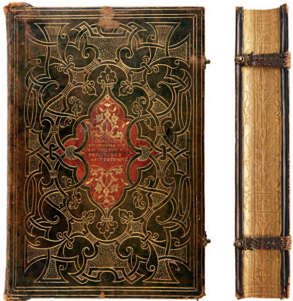
Abb. 1.3.2a und 1.3.2b

L. CHARRON 1982; CONIHOUT/RACT-MADOU 2013; LAFFITTE/LE BARS 1999; LE BARS 2016.