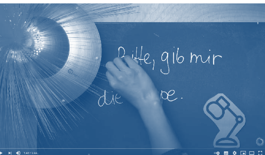
Abb. 4: Ida schreibt Beispielsätze zum Ausdruck von Bitten und markiert Ausdrucksmittel in 24h Deutsch mit Ida

gen ergänzt). Die Veröffentlichung durch YouTube lässt die Freischaltung von Untertiteln und die Anpassung der Wiedergabegeschwindigkeit zu. Diese Optionen können beim selbstständigen Lernen bzw. in selbstständigen Lernphasen unterstützen. Die möglichen Interaktionen scheinen sich auf den ersten Blick auf die Steuerung des Videos zu beziehen. Jedoch gibt es auch die Möglichkeit, das Tempo zu ändern sowie die Untertitel zu aktivieren und das Video dadurch an die Bedürfnisse der Lernenden anzupassen. Die Interaktionen sind in erster Linie technisch, können aber auch als didaktisch bezeichnet werden.