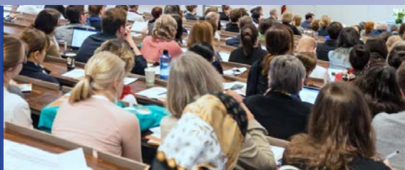
36 Protokoll Mitgliederversammlung

51 MatDaF – gelungenes Debüt der neuen Folge