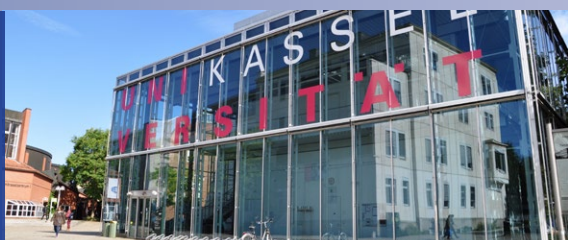
33 49. FaDaF-Jahrestagung 2022