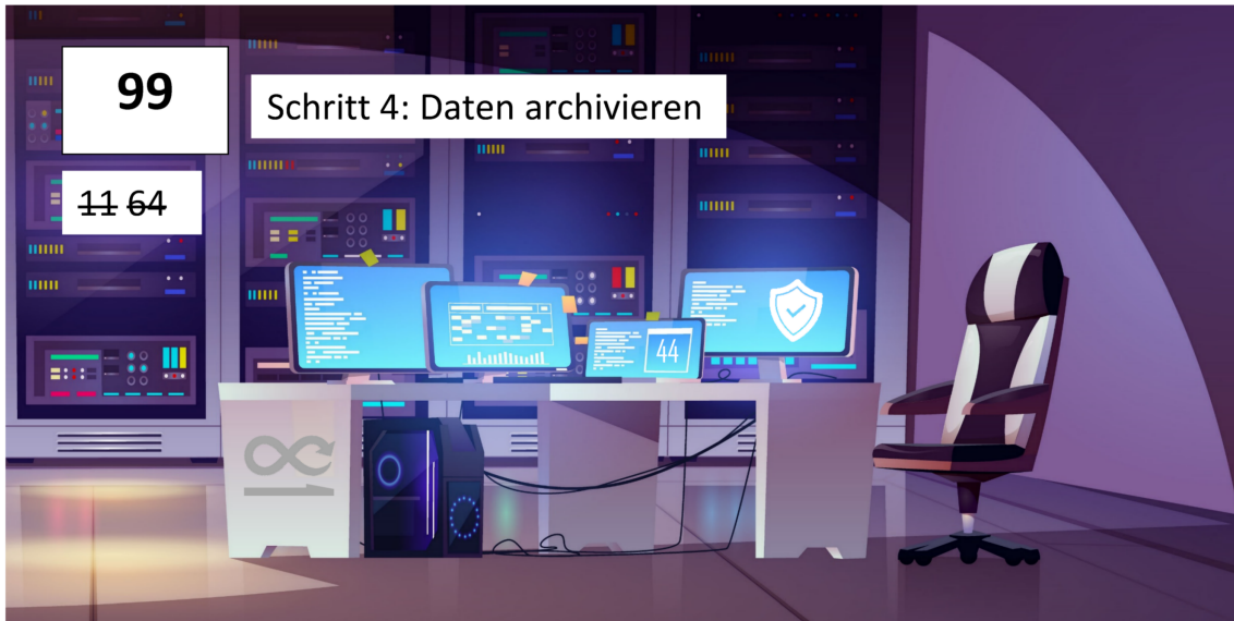
Abbildung 1: Beispiel für eine Schrittkarte in Mission FDM