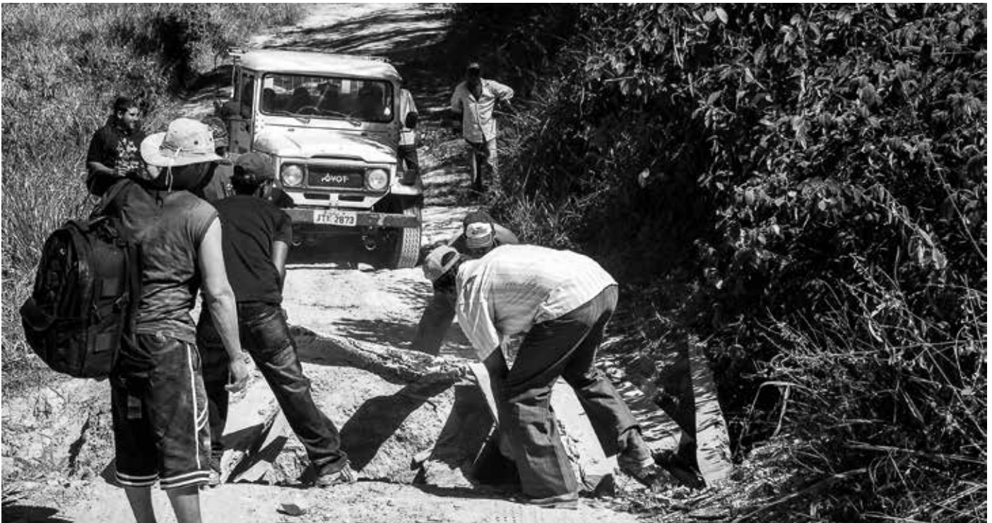
Schwierig, aber machbar: Auf dem Weg zu den Alternativen zur Zerstörung müssen viele Hindernisse aus dem Weg geräumt werden

Der Befund ist eindeutig und wird durch immer neue Studien und die aktuellen Zahlen zur Entwaldung bestätigt: Brasilien ist und bleibt ein globaler Hotspot bei der Vernichtung von Regenwald – mit einer drastischen Zunahme in den drei Jahren der Regierung Bolsonaro.