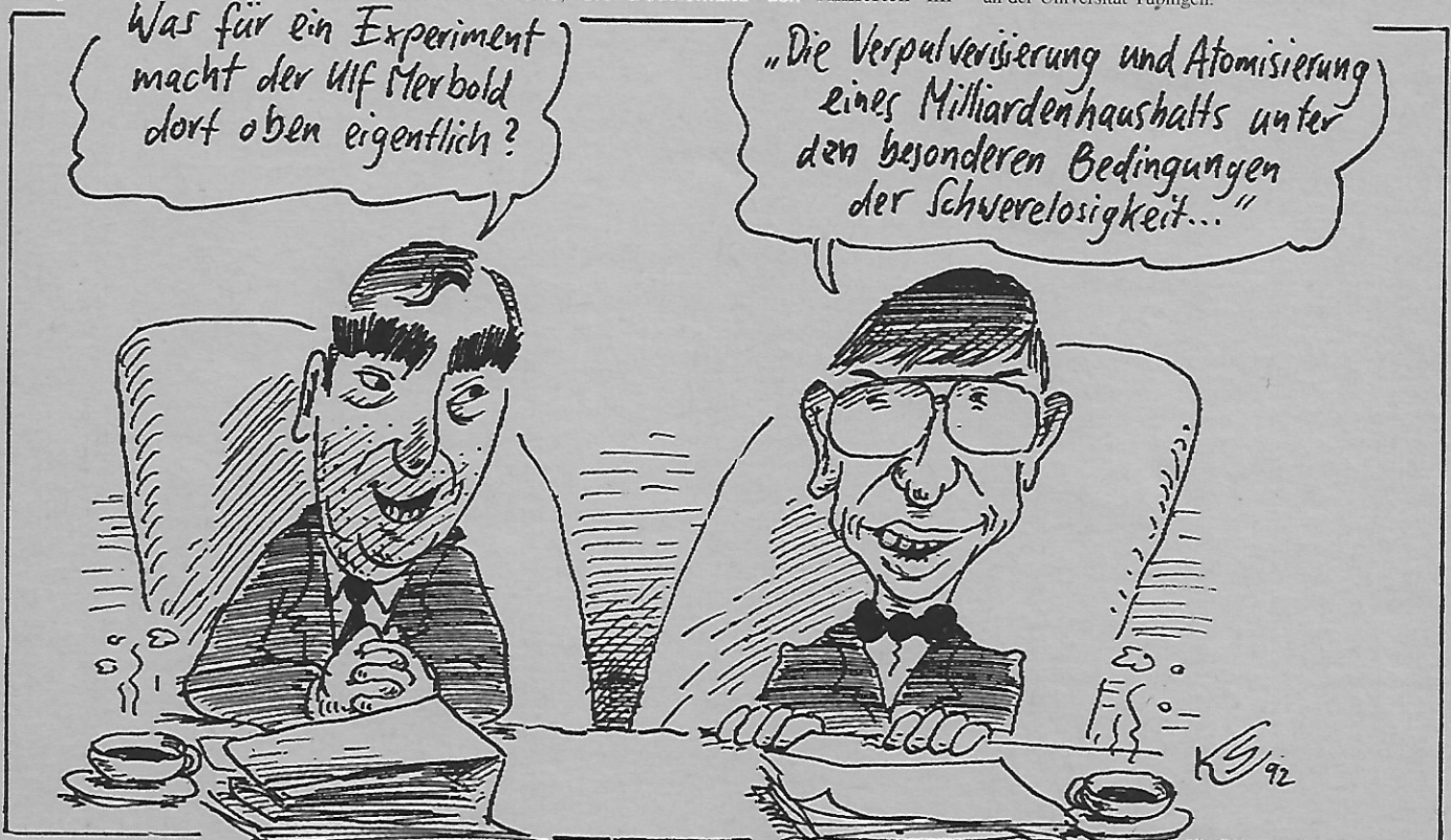
Zeichnung: die tageszeitung

entwickelnder Konflikte befriedet und die Entstehung künftiger kriegerischer Auseinandersetzungen verhindert werden müssen, und die interdisziplinäre Friedens- und Konfliktforschung wie kein anderer Wissenschaftszweig geeignet ist, zu diesen Zwecken die Erfahrungen systematisch aufzuarbeiten und auf dieser Grundlage die aktuelle Politik einschlägig zu beraten“, wie die Senatskommission für Friedens- und Konfliktforschung der Deutschen Forschungsgemeinschaft feststellte. Auch die deutsche Vereinigung hätte eine Erhöhung der Mittel notwendig gemacht, weil es in den neuen Bundesländern Ansätze für eine wissenschaftlich qualifizierte Friedens- und Konfliktforschung gab, die Unterstützung verdient hätten. Außerdem besteht, gerade angesichts der erdrückenden Weltprobleme, zunehmender regionaler und ethnischer Konflikte auch in Europa, globaler Gefährdungen, die Konflikte nach sich ziehen, und der sich weiter verschärfenden Nord-Süd-Problematik sowohl ein ständig wachsender Bedarf als auch ein ständig wachsendes Interesse an friedenswissenschaftlichen Untersuchungen. An zahlreichen Hochschulen wurden in den letzten Jahren Arbeitskreise und Institute gegründet, was zeigt, daß es viele Menschen gibt, die sich wissenschaftlich fundiert