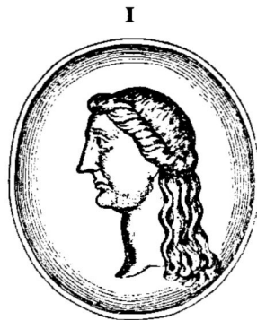
AEMILIVS PAVLVSPAPINIANVS. EX AMETHYSTO FVLVII VRSINI.

Was mochte über beinahe eineinhalb Jahrtausende hinweg die Männer Papinian und Gryphius zusammengeführt haben? Etwas von Unsterblichkeit hatte zweifellos dabei seine Hand im Spiel – ein ewiges Angedenken Papinians , das bis zu Andreas Gryphius drang, und das dieser seinerseits für die Nachwelt stärkte. Gryphius ließ sich von der Person des Papinian fesseln und wollte auch andere fesseln. Er greift gar zu dem Hilfsmittel, daß er der Druckausgabe seines Trauerspiels vom Jahre 1659 in Kupfer gestochene Bildnisse der wichtigsten darin vorkommenden Personen beifügte, angefertigt nach Gemmen und Münzen, teils nach den Publikationen des am Ende des 16. Jahrhunderts wirkenden humanistischen Gelehrten Fulvio Orsini ( Fulvius Ursinus ), teils aus eigener Sammlung.