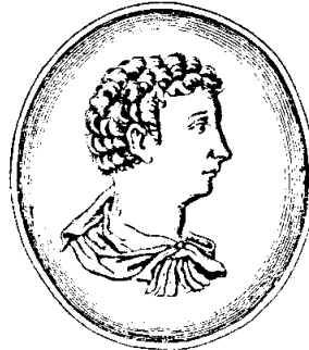
GETA. EX NVMMO ARGENTEO A. GRYPHII.

Abb. 7: Geta. Nach einer Münze. Aus der Ausgabe des Dramas von 1659.