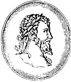
D. SEPTIMIUS SEVERVS. EX NVMMO A. NEO A. GRYPHII.

Abb. 4: Septimius Severus. Nach einer Münze. Aus der Ausgabe des Dramas von 1659.