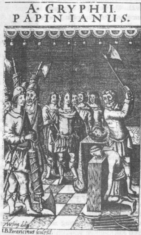
Abb. 9: Hinrichtung Papinians nach Tötung seines Sohnes. Kupferstich von Johann Baptist Paravicini. Aus der Ausgabe des Dramas von 1659.

Der eingeleitete Geschehensgang ist unumkehrbar. Es wird durch die Gegenüberstellung im zweigeteilten Titel auch sichtbar, daß die Unausweichlichkeit seines Schicksals mit der Charakterfestigkeit Papinians zu tun haben muß. In ihr wird der Schlüssel zu der Zwangsläufigkeit der Entwicklung präsentiert. Es gibt nichts für das Leben zu retten, weil das in Standhaftigkeit und Unbestech-