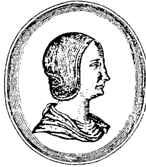
IVLIA. EX NVMMO ARGENTEO A GRYPHII.

Abb. 5: Julia Domna, zweite Frau des Septimius Severus und Mutter von Caracalla und Geta. Nach einer Münze. Aus der Ausgabe des Dramas von 1659.