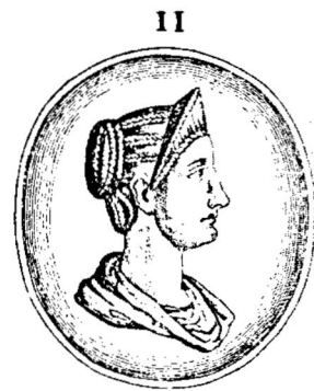
PLAVTIA. EX AMETHYSTO FVLVII VRSINI.

Abb. 2: Papinian. Nach einer Gemme. Aus der Ausgabe des Dramas von 1659.