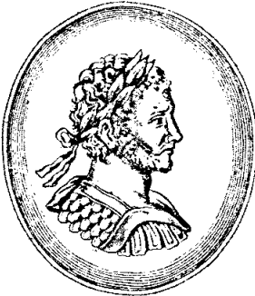
ANTONINVS CARACALLA. EX NVMMO ARGENTEO A. GRYPHII.

Abb. 6: Caracalla. Nach einer Münze. Aus der Ausgabe des Dramas von 1659.