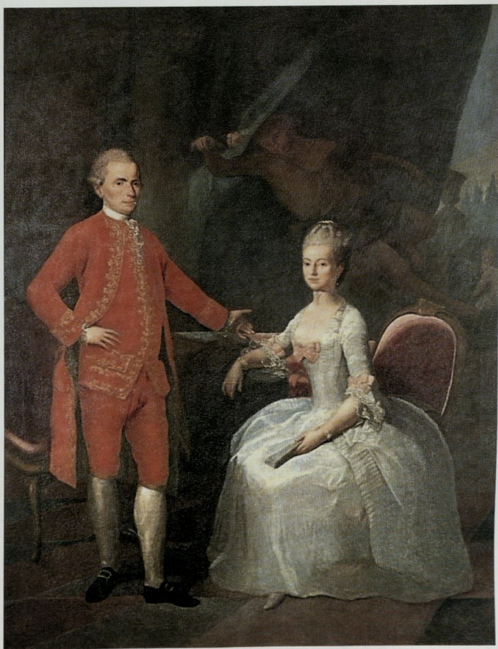
3 Fürst Kraft Ernst und Fürstin Maria Theresia. Ölbildnis von Martin Knoller, 1776