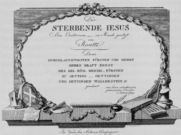
7 Titelseite der 1786 im Druck erschienenen Partitur des ›Sterbenden Jesus‹

ten eine Bemerkung zum Endzwecke, eine gute Kirchen Musik zu errichten überschriebene Denkschrift, in der er eine Reihe personeller Veränderungen vorschlug, die aber letztlich nur zum Ziel hatten, den beinahe 60-jährigen Steinheber endlich abzulösen und ihm selbst dessen Posten zu sichern. Zur Steigerung des musikalischen Niveaus sollten künftig, wie bei der Uraufführung des ›Sterbenden Jesus‹ beispielhaft vorgeführt, die Mitglieder der Hofkapelle, deren Besoldungen er von Fall zu Fall in moderatem Umfang anzuheben empfahl, regelmäßig in der Pfarrkirche eingesetzt und ein kleines, ebenfalls fest besoldetes Vokalensemble gebildet werden. Für den Orgeldienst beabsichtigte der Chorregent ›in spe‹ einen Substituten anzustellen. 119 Obwohl der Fürst sich durchaus ernsthaft mit den Vorschlägen beschäftigte, wie eigenhändige Bemerkungen auf der Denkschrift belegen, verlief