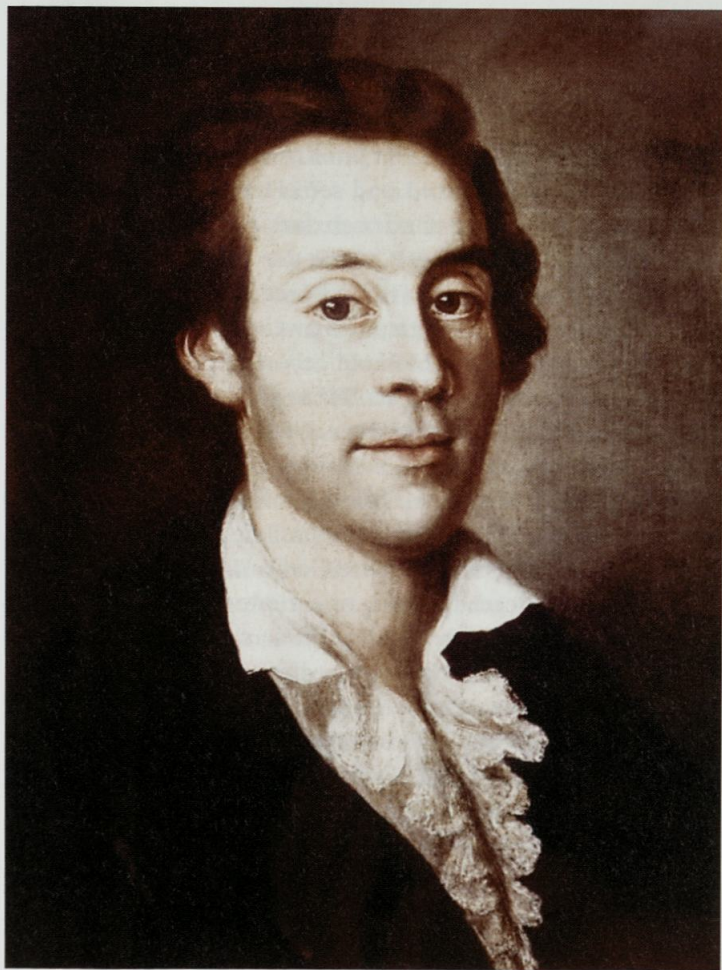
1 Antonio Rosetti. Anonymes Ölbildnis, um 1790