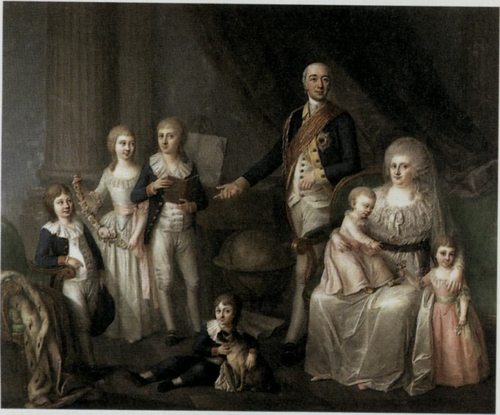
9 Herzog Friedrich Franz I. mit seiner Ehefrau Louise und den Kindern. Ölbildnis von Daniel Woge, 1788

außen hin als Darlehen deklariert worden waren: Euere Hochfürstl. Durchlaucht werden sich gnädigst erinnern: daß Höchstdieselben den darüber von mir nach der Hand aufgestellten Schuld-Schein blos in der Absicht verlangt haben, um bey dem Publico den Schein einer Schenkung zu vermeiden. Er zeigte sich jedoch erbötig, die im Juni fälligen 100 Gulden samt 25 Gulden Zinsen sogleich mit jenen 20 Louisd'or Reisegeld zurückzuzahlen. 143 Schließlich bat er um seine Entlassung, wobei er nicht vergaß, sein Bedauern darüber auszudrücken, die Gnade seines Fürsten, dem er seith so viel Jahren treu, mit ganzer innigster Ergebenheit und mit Ehren gedient , dadurch verloren zu haben, weil ihn ein nicht vorhergesehenes Schicksal plötzlich [!] in andere Dienste führte. 144