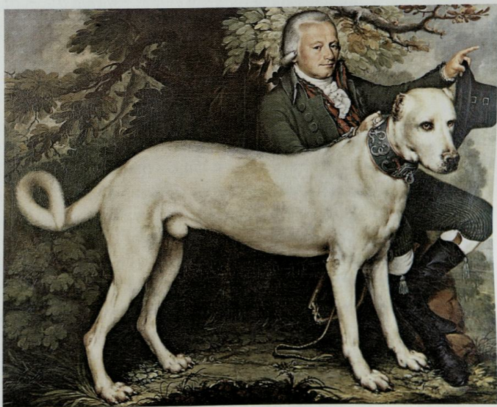
8 Fürst Kraft Ernst mit englischer Dogge. Anonymes Ölbildnis, um 1790

then wieder abschreiben müssen, und auf diese Arth viel Kundschaft noch bies jezt verlohren. Vor allem aber zeigt er sich enttäuscht darüber, nach Reichas Weggang keine Aufbesserung erhalten zu haben: Ich kan nicht leugnen, daß ich im vorigen Jahre, als nach dem Abzug des Reicha, dessen ansehnliche Besoldung zurückgefallen war, mir Hoffnung machte, Seine Hochfürstl: Durchlaucht würden etwa aus Höchsteigener Bewegung auf mich gnädigste Reflexion machen, um so mehr, da Höchstdieselben bey jeder Gelegenheit die gnädigsten Gesinnungen gegen mich äußerten. Fürst Kraft Ernst scheint dies alles kaum berührt zu haben, wie sein lakonischer Kommentar ( moi ad acta ) auf der Rückseite des Schreiben belegt. 125