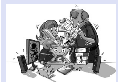
Wissen lässt sich nicht eintrichtern ...

Während diese Lerninhalte in einigen Sendungen für Kinder kein störendes Element sind, sondern den Rezeptionsgenuss und die Fantasie der Handlungsmächtigkeit sogar noch erhöhen, ist es jedoch vermutlich meist eine eher unangenehme Erfahrung, vor allem dann, wenn die Geschichte nicht zu Ende erzählt wird und die ProtagonistInnen, mit denen sich die Kinder gerade erst angefreundet haben, in den Hintergrund gedrängt werden.