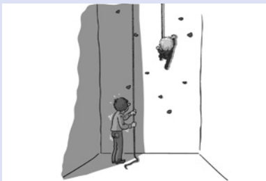
Es stellt Herausforderungen, gibt Sicherheit und Hinweise zur rechten Zeit, ...