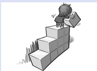
... sodass sich das Kind selbstbestimmt sein Wissen aufbaut ...