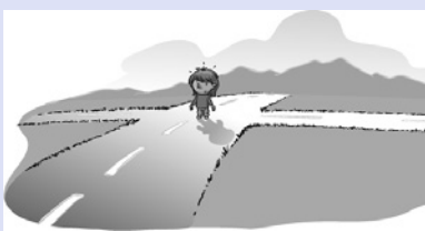
Eine Laissez-faire-Haltung ohne Orientierung ist eine Überforderung des Kindes.