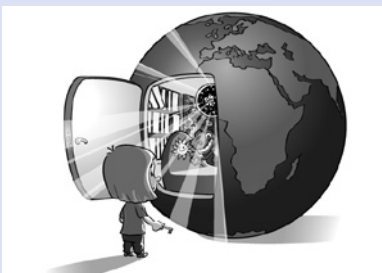
... und sich die Welt selbst erschließen kann.

Der Gedanke der Fernsehverantwortlichen, einen trockenen, langweiligen Inhalt, die »bittere Pille«, in einen attraktiven Mantel (Zuckerguss und Glanzpapier) zu hüllen, ist durchaus nachvollziehbar und hat eine lange pädagogische Tradition. Es erinnert an den Song aus Disneys Mary Poppins , »Wenn ein Löffelchen voll Zucker bittere Medizin versüßt«, was sich in diesem Fall auf Lebertran auf einem Löffel weißem Zucker nach einem Regenspaziergang bezieht. Was vielleicht in anderen Kontexten funktionieren mag, birgt beim Fernsehen die Gefahr, dass Kinder ihre Motivation verlieren und sich vom Programm abwenden. Und: Nach dem heutigen Wissensstand ist weder ein unangenehm schmeckender Löffel Lebertran bei gesunder Ernährung notwendig, noch Rohzucker besonders gesundheitsförderlich.