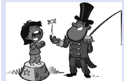
... oder per Zuckerbrot und Peitsche antrainieren.