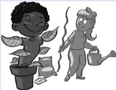
Ein modernes pädagogisches Lernverständnis muss immer von der individuellen Entwicklung ausgehen, gibt Nährstoffe und Orientierung zur richtigen Zeit und lässt das Kind wachsen.