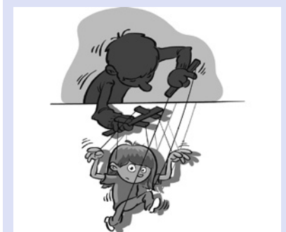
... noch entwickeln sie sich ausschließlich nach den Vorgaben von Erwachsenen.