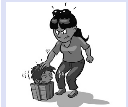
Kinder lassen sich weder (zumindest nicht dauerhaft) in vorgeformte Boxen pressen ...