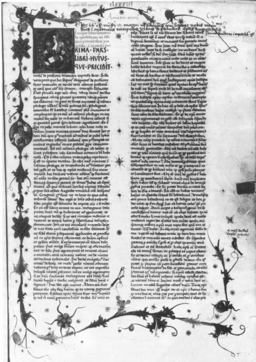
Cod. I. 2. 2° IV, 183 r Ludolf von Sachsen, Vita Christi. Augsburg, Mitte 15. Jahrhundert. Schenkung des Augsburger Bischofs Kardinal Peter von Schaumburg (dessen Wappen in der Initiale).