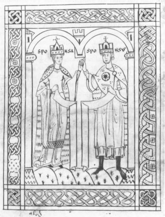
Cod. I. 2. 2° 13, 1° Honorius Augustodunensis, Opera exegetica. Süddeutschland, 12./13. Jahrhundert.

Leider liegt diese frühe Phase der Füssener Klostergeschichte fast völlig im Dunkeln; nur mühsam läßt sich aus der legendenhaft ausgeschmückten Vita sancti Magni ein historischer Kern herauschälen. Demnach blieb Theodor, der Begleiter des Magnus, in Kempten zurück, um dort ein Kloster zu errichten, Magnus selbst aber gründete um die Mitte des 8. Jahrhunderts in Füssen eine Zelle, die wahrscheinlich alsbald nach seinem Tod zerstört wurde. Erst etwa 100 Jahre später ging aus der wiederbelebten Zelle die Abtei St. Mang hervor. Noch mehr im Dunkeln liegt die frühe Bibliotheksgeschichte St. Mangs, denn in die Zeit des hl. Magnus reicht mit Sicherheit kein Handschriftenrest zurück. Erst im 9. Jahrhundert, also nach der Wiedererrichtung der Zelle, beginnen die schriftlichen Quellen zu fließen. Ältester und ehrwürdigster erhaltener Zeuge der Füssener Klosterbibliothek ist eine Benediktinsregel aus der Zeit um 800; sie gehörte sicher zur Grundausrüstung des Klosters und ist eine der ältesten Handschriften mit dem Regeltext überhaupt. Geschrieben wurde diese Handschrift freilich nicht im Magnus-Kloster, sondern im nahegelegenen Benediktbeuern. Da es im Frühmittelalter eine häufig geübte Praxis war, daß Mönche bei der Besetzung eines neugegründeten Klosters aus ihrem Mutterklo-