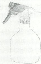
T2 G1 Sanuk