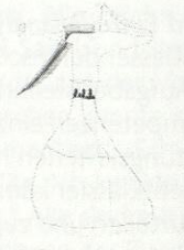
T3 G2 Elke