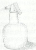
T1 G1 Silke

Test 1: Zeichnen einer Sprühflasche aus der Vorstellung