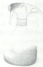
T4 G1 Sanuk