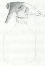
T3 G1 Sanuk