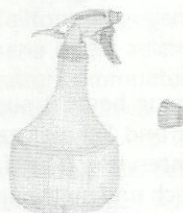
T2 G1 Silke

Test 2: Abzeichnen nach handelndem Umgang mit der Sprühflasche (G1)