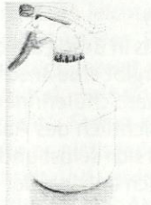
T2 G2 Elke