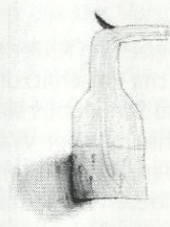
T1 G2 Elke