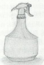
T3 G1 Silke

Test 3: Zeichnen aus der Vorstellung, zwei Stunden nach dem Abzeichnen