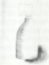
T1 G2 Stefan

Test 4: Zeichnen aus der Vorstellung, zwei Wochen nach dem Abzeichnen