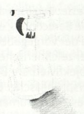
T4 G2 Elke

Die Aufstellung der Zeichnungen zeigt zwei Gruppen, die sich lediglich durch den zweiten Test unterscheiden, in dem die erste Gruppe (G 1) vor dem Abzeichnen mit der Wassersprühflasche hantieren durfte, die zweite Gruppe (G 2) hingegen nur abzeichnete. Ausgewählt für die Darstellung in vorliegendem Beitrag wurden die Arbeiten von vier Siebtklässlern, deren Zeichenfähigkeiten je Gruppe kontrastierend im besseren und im schwächeren Klassendurchschnitt liegen.