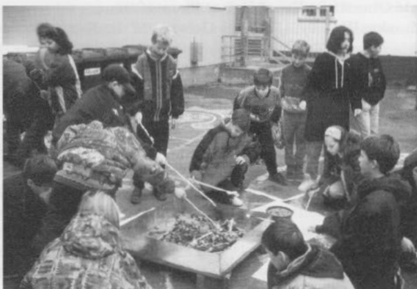
unten: Mit Holzkohle malen