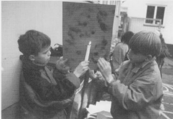
oben links: Mit Rauch malen