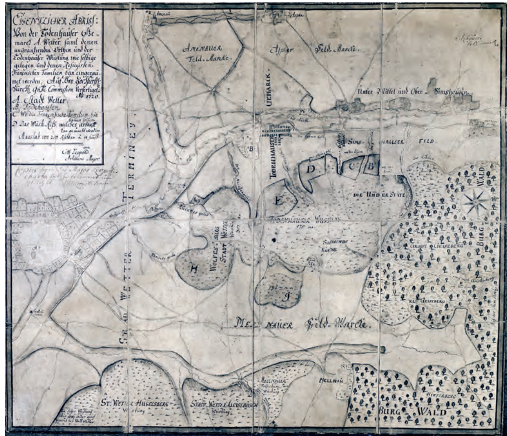
G.H. Leopold: Eigentlicher Abriss von der Todenbäuser Gemark A[mt] Wetter samt denen angränzenden Orten und der Todenbäuser Wüstung, wie selbige gelegen und denen Refügirten Francosischen Familien kann eingeraumet werden [...], 1720