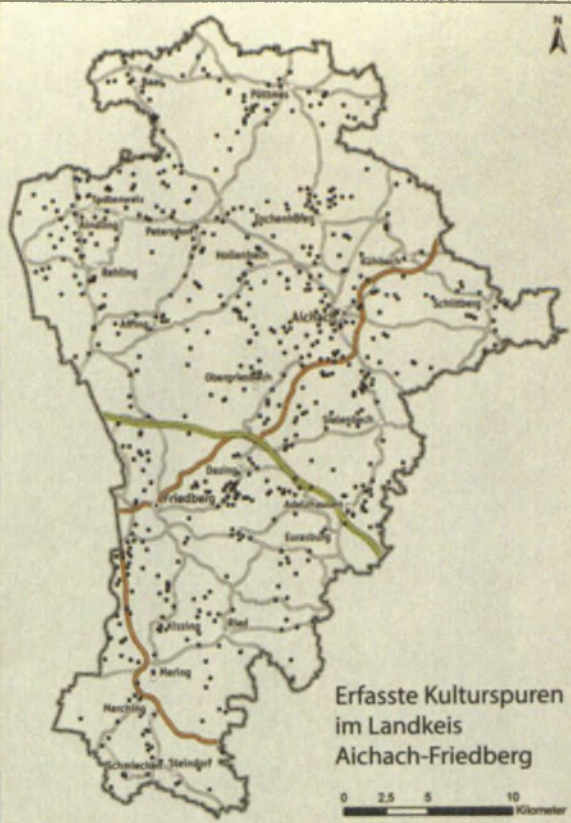
Erfasste Kulturspuren im Landkreis Aichach-Friedberg