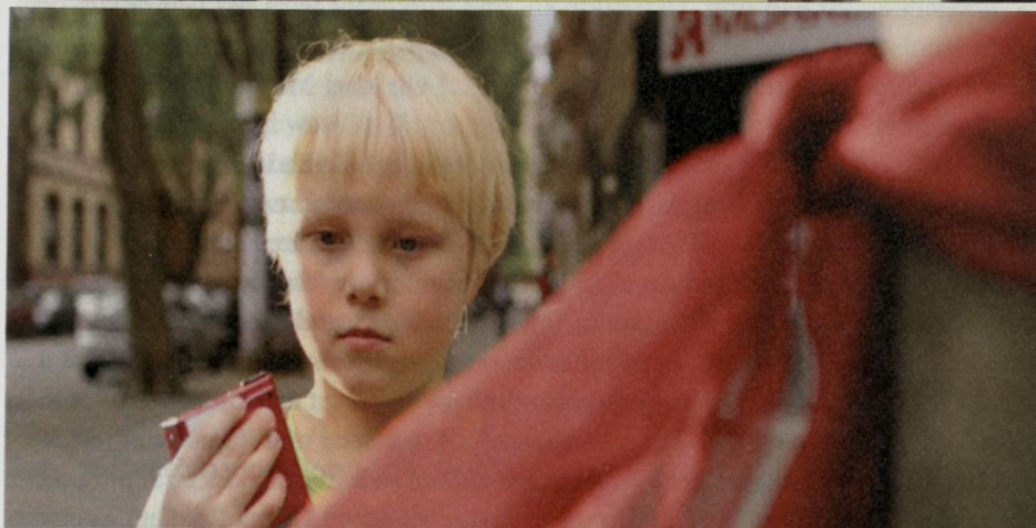
Abb. 1: Desorientierung (Untersicht, gekrümmter Raum, Wortfetzen im Kopf) und Re-Orientierung (Normalsicht, gerader Raum, klare Anweisung aus dem Rekorder): Ricos Gang zum Einkaufen (RICO, OSKAR UND DIE TIEFERSCHATTEN, 0:14:40 bzw. 0:15:12)