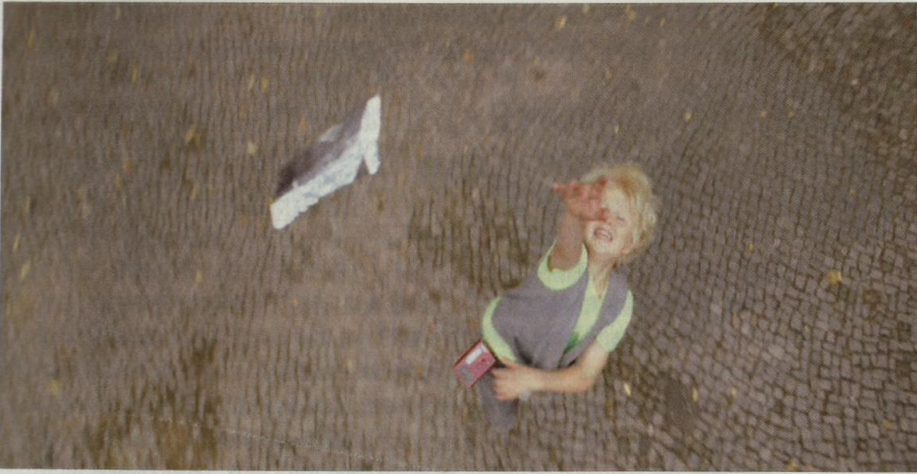
Abb. 4: Unmittelbarkeit audiovisueller Präsenz und Weiterschreibung eines filmischen Codes: „Fundpapierchen“ in der Luft (RICO, OSKAR UND DIE TIEFERSCHATTEN, 0:08:34)

Aber noch weniger als einem Kinderbuch wird wohl einem Kinderfilm Komplexität zugetraut – schon aus dem Grund, dass auch ein Kinderfilm vor allem ein Film ist. Die kulturelle Diskreditierung des Films als billige und anstrengungslose Massenunterhaltung geht auf die Anfänge des Mediums als Jahrmarkt- und Variété-Attraktion zurück. Bis heute ist sie auch in Bildungsplänen zu spüren, wenn diese z. B. eine Grenze zwischen „literarischen Texten“ und Filmen ziehen (vgl. Abiturstandards der KMK, S. 19 f.) – als ob ein Film nicht als Text und nicht als Form von Literatur aufzufassen ist. Die Ausführungen zu RICO, OSKAR UND DIE TIEFERSCHATTEN haben indes gezeigt, dass ein Film keineswegs per se „einfach“ ist, sondern komplexe Rezeptionsleistungen wie die Verarbeitung von Rasanz und Dynamik, Kohärenz- und Inferenzbildungen, Deutung und Interpretation erfordert. Natürlich: Ein schlechter Film tut dies nicht; ein schlechtes Buch aber auch nicht.