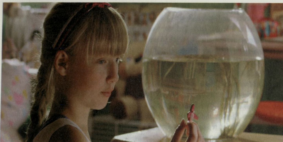
Abb. 2: Intensive Bilder und ambivalente Symbole: der Besuch bei Sophia (RICO, OSKAR UND DIE TIEFERSCHATTEN, 0:59:34)

bleiben: Das Tüllkleid wird im Knien getragen, der Goldfisch hat eine Krankheit, das Plastikflugzeug nur einen Flügel. Zurück auf der Straße fasst Rico das Erlebte in seinem Merkrekorder zusammen: „Sophia hat – das graue Gefühl!“