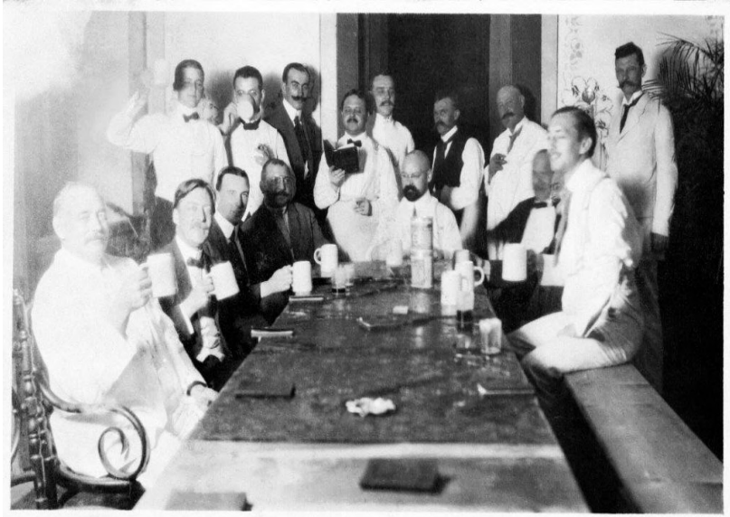
Abb. 3: „Bier Abend Galler, 1. Juni 1913“

Die vier übrigen Fotografien (Schirp_01_162; 164; 165; 319) ähneln der in Abbildung 2 besprochenen vom Arrangement des Motivs, jedoch kann ein Vergleich zu weiteren Informationen führen.