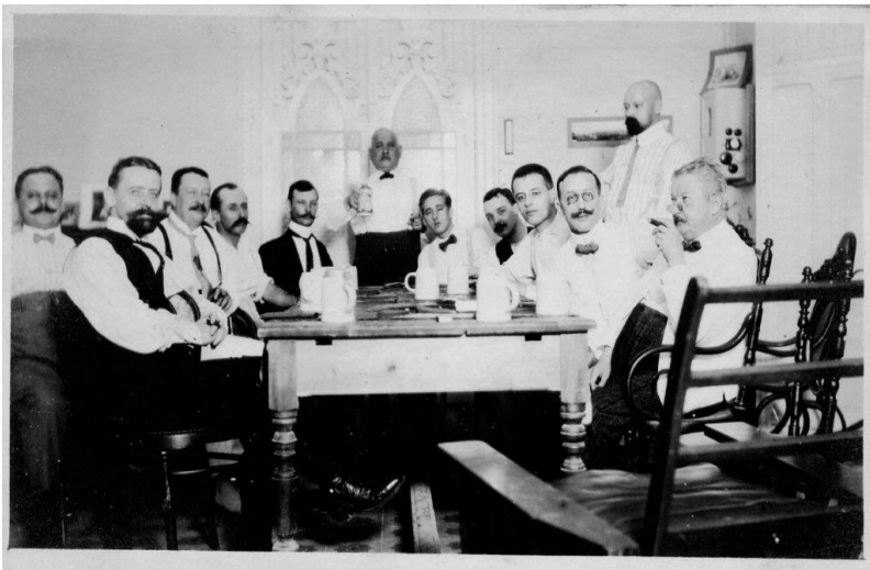
Abb. 1: Club de Caballeros_1

Diese zwei Blickwinkel werden im vorliegenden Aufsatz, soweit es nach mehr als 100 Jahren zwischen Aufnahme und Auswertung retrospektiv möglich ist, aufgearbeitet, um dadurch gleichzeitig zu zeigen, wie die Arbeit mit der Onlinefotosammlung in der Praxis aussehen kann.