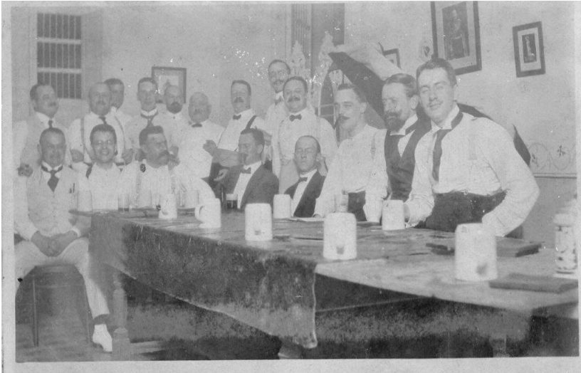
Abb. 4: Der „Club de Caballeros“

Auf der Albenseite befindet sich neben dem Foto eine Beschriftung: „Bier Abend Galler, 1. Juni 1913, Blitzlicht-Aufnahme“, die das Foto nicht nur zeitlich einordnet, sondern zudem das Treffen der Männer thematisiert.