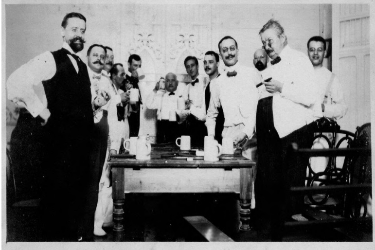
Abb. 2: Mitgliedertreffen des „Club de Caballeros“

zudem eine Weste oder Hosenträger. Bis auf wenige Ausnahmen haben die Männer einen Schnauzer oder einen Vollbart. Sie sind unterschiedlich alt, wobei der jüngste auf circa 25-30, der älteste auf 50-60 Jahre geschätzt werden kann.