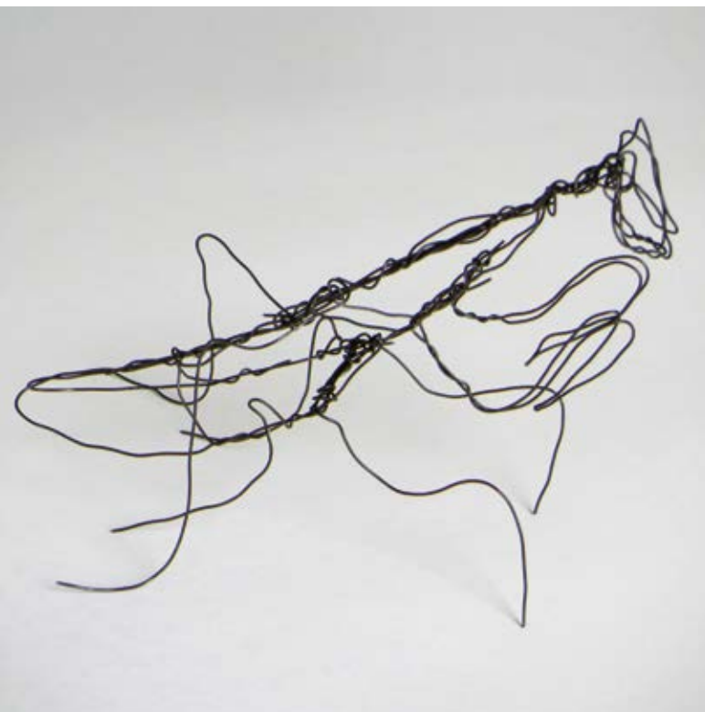
Abb. 3 Gottesanbeterin (Studierendenarbeit, unbehandelter Blumendraht).