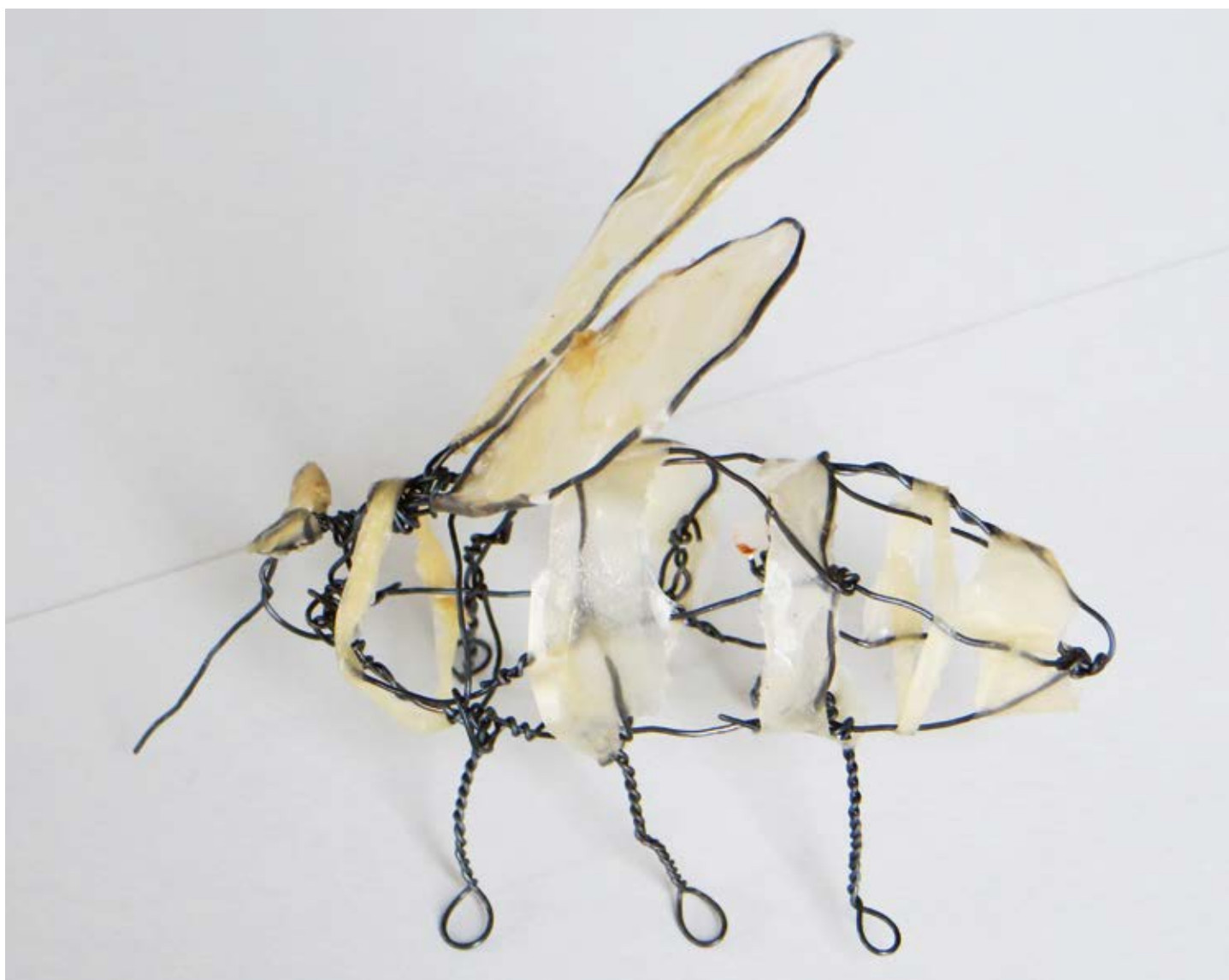
Abb. 6 Tigermücke (Studierendenarbeit, unbehandelter Blumendraht und Japanpapier).

Die selbstgefertigten Plastiken nehmen Form an. Die Studierenden fügen Teile zusammen, verwandeln sie durch ihre persönlichen Ideen, besetzen sie mit Bedeutungen, die nur für sie alleine Gültigkeit haben. Durch ihre fragende Annäherung an Material und Thema erobern sie sich unbekanntes Terrain (vgl. Kathke 2001). Sie staunen über das Universum der Flügeltiere, das sie entwickelt haben, das sie auch ein Stück weit dabei begleitet hat, sich selbst, die eigenen Fähigkeiten und persönlichen Besonderheiten besser kennen zu lernen. Obwohl die Papiere noch nicht getrocknet sind, nehmen sie die Arbeitsergebnisse gleich wieder an sich, um sie voller Freude nachhause zu transportieren. Kunst beflügelt. Und noch mehr: Die zukünftigen Lehrerinnen und Lehrer hatten es gewagt, sich in das nicht mehr Selbstverständliche hineinzubegeben, das gefühlvolle Arbeiten mit den Händen, die Formung eines widerständigen Materials, die Freude des Experimentierens, die Leichtigkeit des kreativen Tuns, die sich Kindern eben nur vermitteln lässt, wenn sie selbst erfahren wurde.