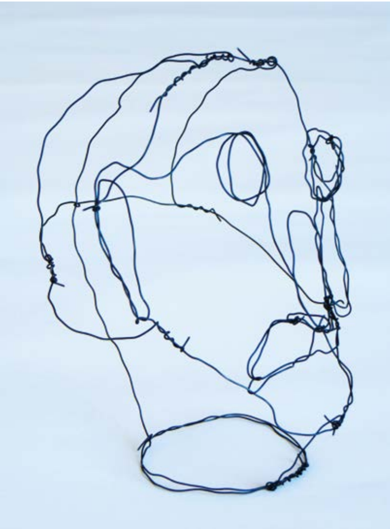
Abb. 2 Vorausschauender (Studierendenarbeit, unbehandelter Blumendraht).

eine Herausforderung darstellen. Ausgewählte Bereiche der drahtgeformten Wesen überziehen die Studierenden mit Papier, bis ein Wechsel zwischen offenen und geschlossenen Flächen entsteht. Dabei experimentierten sie mit Seiden-, Japan- und Butterbrotpapier, Teebeutelhüllen und stark verdünntem Tapetenkleister, den sie mit Borstenpinseln auftragen.