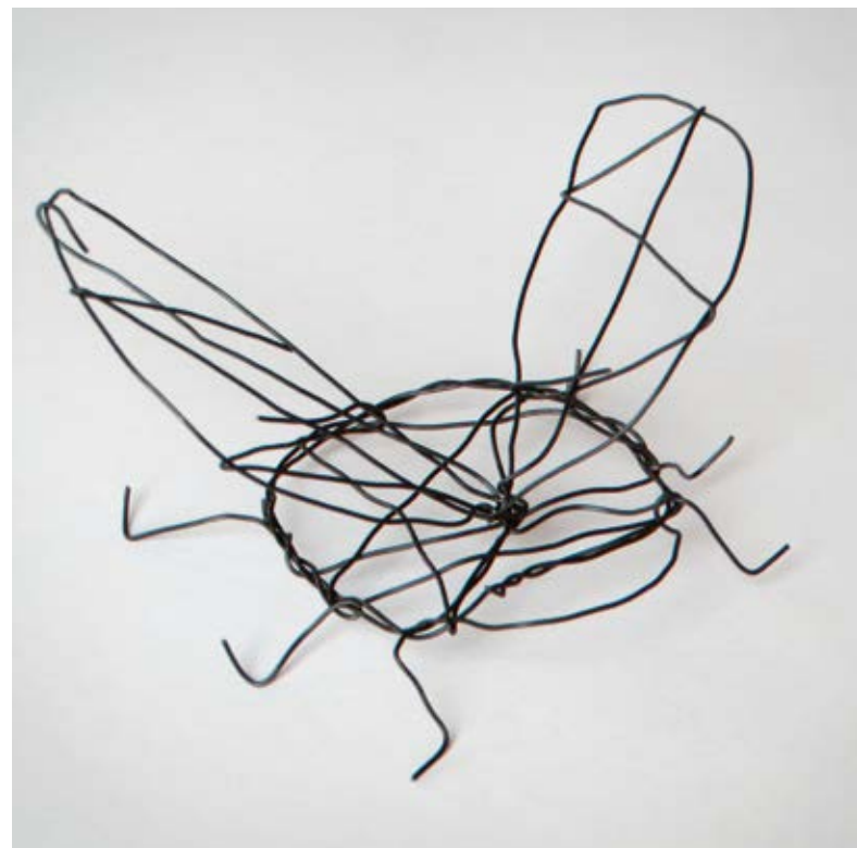
Abb. 4 Marienkäfer (Studierendenarbeit, unbehandelter Blumendraht).