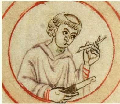
Messer und Federkiel Darstellung eines Schreibers (13. Jh.)

Der Schreiber oder die Schreiberin – bei Handschriftenbeschreibungen: die Hand – benutzte eine Vogelfeder . Die von Gänsen wurde am meisten verwendet (Gänsekiel), allerdings ohne die störende Befiederung. Die Feder wurde an der Spitze gespalten und zugeschnitten. Zu den notwendigen Utensilien beim Schreiben gehörte stets ein scharfes Messerchen , mit dem die Feder immer wieder nachspitzt wurde, da sie sich schnell abnützte. Das Messer diente auch dazu, fehlerhaft Abgeschriebenes auf dem Pergament wegkratzen zu können, um es dann erneut beschreiben zu können.