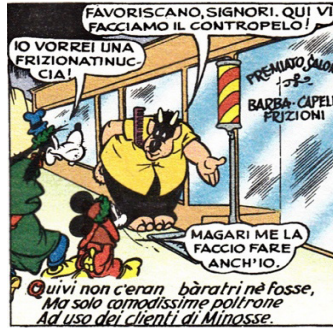
Fig. 8: Fondamentale per la ricreazione deformante dell'italiano dantesco è l'uso di un lessico funzionale arcaizzante.

tosto m'introdusse nel secondo") e anche quaggiuso ("nel chiudere il portello del forziere / è questo degli avari il triste dramma: / quaggiuso son ridotti al miserere") ecc.