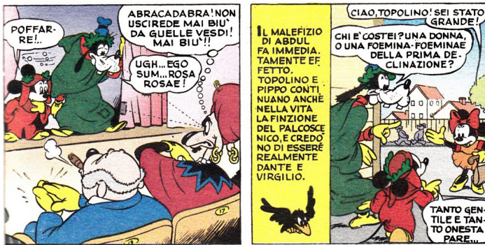
Fig. 3. Le vignette immediatamente successive fissano gli estremi del patto parodico con il lettore legando i personaggi del fumetto seriale al loro travestimento parodico.

scuola che costituisce una delle peculiarità de “L’inferno di Topolino”. 12 In seguito all’incantesimo di un ipnotizzatore presente in sala, Topolino e Pippo rimangono legati ai personaggi appena interpretati. Pippo-Virgilio recita in latino, ma si tratta semplicemente di esercizi di declinazione o di coniugazione elementare ( ego sum, rosa-rosae ) resi espliciti dall’ammiccamento metalinguistico “foemina-foeminae della prima declinazione”, in cui si strizza l’occhio al lettore (presumibilmente non a digiuno di conoscenze di latino di base) sottolineando ancora una volta l’intenzione ludico-parodica (fig. 3).