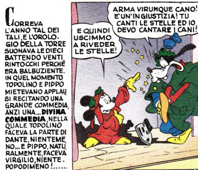
Fig. 2. Gli indizi testuali a guida del lettore nella decodifica del gesto parodico sono inseriti tanto nello spazio propriamente narrativo della didascalia che in quello dialogico delle nuvolette.

titolo il riferimento al poema di Dante attraverso la sillessi 11 “[...] Topolino e Pippo mietevano applausi recitando una grande commedia, anzi una... divina commedia ” (sillessi peraltro segnalata anche tipograficamente dal grassetto) e svelando esplicitamente la relazione tra i personaggi dell’ipo- e dell’ipertesto (“Topolino faceva la parte di Dante” e “Pippo faceva Virgilio”). Perché il riconoscimento dell’ipotesto venga assicurato anche a livello dialogico del testo in nuvoletta, l’ipertesto parodico inizia con una citazione della cantica dantesca, pronunciata da Topolino-Dante: “E quindi uscimmo a riveder le stelle!”. La scelta di questo verso è tutt’altro che casuale: si tratta dell’ultimo verso dell’ Inferno , quindi di una citazione emblematica (l’incipit e la conclusione dei grandi capolavori sono sempre più facilmente memorizzabili e memorizzati) scelta come prima battuta della parodia disneyana per lanciare al lettore dell’ipertesto un ulteriore segnale a alta riconoscibilità (v. anche § 5).