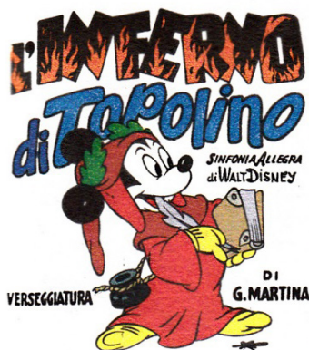
Fig. 1. Topolino-Dante, riconoscibile in quanto Topolino grazie a orecchie, muso, scarpe e guanti gialli, e in quanto Dante – tradizionalmente rappresentato di profilo – grazie a lucco 10 rosso, corona d'alloro e attributi da poeta (penna d'oca, librone, calamaio).

iconici: l'abito di panno rosso, il lucco, che lo copre interamente avvolgendogli il capo a mo' di moderno cappuccio, sormontato dall'immane corona di alloro che gli cinge le tempie e lascia in evidenza il volto, quasi sempre ritratto di profilo [...]. (Pacifico 2015, s.p.)