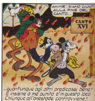
Fig. 4. Tra i tratti fonetici caratteristici dell'italiano pseudoantico di Topolino figurano forme non dittongate ( loco ) e parole piane di base latina ( onestade ).

La parodia disneyana riproduce inoltre alcuni casi di apocope sillabica (caduta di una sillaba in fine di parola) come pie' (< piede), fe' (< fece), ver' (< verso), e si esibisce in numerose apocopi vocaliche in linea con la tradizione letteraria italiana soprattutto in versi: pensier , passegger , legger insiem ecc.