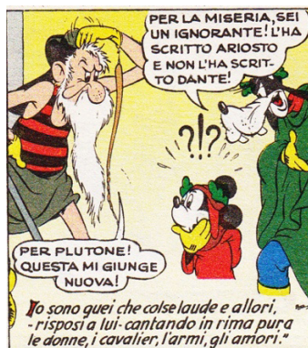
Fig. 9.: Lo stile della tradizione poetica italiana viene riprodotto giocando con citazioni modificate o falsamente attribuite.

Nel gioco delle citazioni gli autori mescolano il travestimento parodico dell’ipotesto con altri elementi della tradizione lirica italiana danteschi e non. Ecco quindi decontestualizzazioni di versi di altre cantiche della Commedia come l’“era già l’ora che volge il disio” (da Pg. VIII, 1) in: “era già l’ora che volge’l disio / a’ bimbi di trovarsi insieme ai padri / uniti attorno a un desco dolce e pio...”, di altri componimenti dello stesso Dante (Io dissi allora: ‘Maestro, non tremare! / Non vedi che la bestia che t’angoscia / tanto gentile e tanto onesta pare?!’), o addirittura di altri autori della tradizione poetica italiana (“io sono quei che colse laude e allori, / – risposi a lui – cantando in rima pura / le donne, i cavalier, l’armi, gli amori”, citazione demistificata tra l’altro dalle battute nelle nuvolette, v. fig. 9).