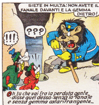
Fig. 6. Sopravvive nella parodia disneyana persino il dimostrativo arcaico desso .

Un cenno a parte meritano le forme verbali della parodia disneyana. L'insistenza sul passato remoto si realizza nel pieno rispetto delle forme di terza persona plurale dell'italiano delle origini. Troviamo così nel fumetto le forme arcaiche in -iro ("Nuovi prodigi all'occhio ci appariro!"), esito della desinenza plurale latina -(VE)RŪ(NT) con accento ritratto secondo la pronuncia del latino colloquiale, che ha generato la sincope della sillaba VE e la caduta di NT (cfr. Patota 2007: 159), mentre mancano quelle analoghe in -aro ("e odiarono la gente troppo gaia"; "sovra di noi calarono ad ondate" ecc.). Per quanto riguarda l'imperfetto indicativo la parodia preferisce le forme del fiorentino trecentesco in -ea / -ia senza labioddentale: finia, aveva, scomparia, cadea... ("Tu dèi saper ch'io fui Conte Ugolino / ed arbitravo a Pisa una partita / ch'avea in palio il titol di campione..."). 16