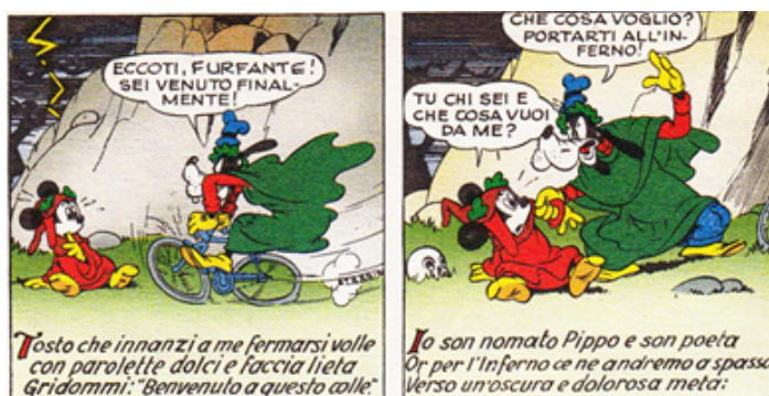
Fig. 10. I disegni raffiguranti l'incontro tra Topolino-Dante e Pippo-Virgilio sviluppano tutto il loro potenziale ludico solo nello scarto con il registro pseudo-letterario delle didascalie.