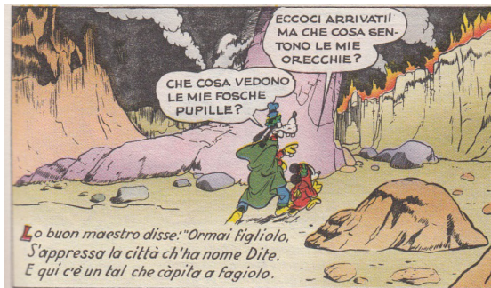
Fig. 5. La parodia riprende l'uso antico dell'articolo definito lo , sia pure con qualche incongruenza rispetto all'italiano del Trecento.

avverbiali perlopiù e perlomeno . Martina riprende il polimorfismo dantesco alternando le forme il e lo , ma, probabilmente ignorando la norma Gröber, la sua selezione è piuttosto casuale o modellata intuitivamente sull'ipotesto. Ritroviamo quindi nella parodia, proprio come in Dante ("Lo buon maestro 'Acciò che non si paia / che tu ci sia', mi disse", If. XXI, 58-59; "Lo buon maestro disse: 'Figlio, or vedi'", If. VII, 115), l'articolo lo nel sintagma "lo buon maestro" ("Lo buon maestro in mezzo al parapiglia, / non fé come la torre che non crolla", oppure "Lo buon maestro allor mi disse: 'Vieni!"; v. anche fig. 5), ma mentre in Dante la presenza di lo si spiega con la posizione a inizio verso, lo sceneggiatore disneyano riproduce una sorta di sintagma fisso ( lo buon maestro ), tanto che altrove nella parodia l'articolo a inizio verso, in mancanza di un esplicito modello dantesco, non è più lo ma il ("Il verso mio di continuar rifiuta", oppure "Il pentimento nato nel suo cuore" ecc.). Altrettanto casuale appare il polimorfismo disneyano tra lo ciel e il ciel ("Quivi lo ciel pareva più sereno" vs. "Messer pollastro, è il ciel che v'ha mandato"), a dimostrazione di come si tratti appunto di una deformazione parodica dell'italiano trecentesco che ne echeggia intuitivamente le caratteristiche senza pretese di rigore sistematico.