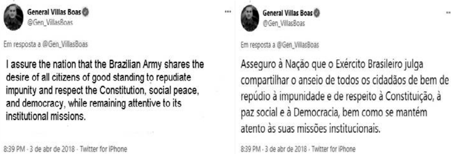
Figure 7: Brazilian Army's Chief using his Twitter profile in a parallel episode and its macro resonances.