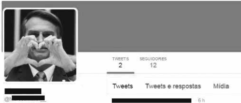
Figure 6: Civilian internet user's Twitter profile displaying a new picture, after the repercussion of the event.

account, not before replacing his own profile picture with another one that showed Jair Bolsonaro 15 [...]». Figure 6, below, shows how that replacement has been configured: