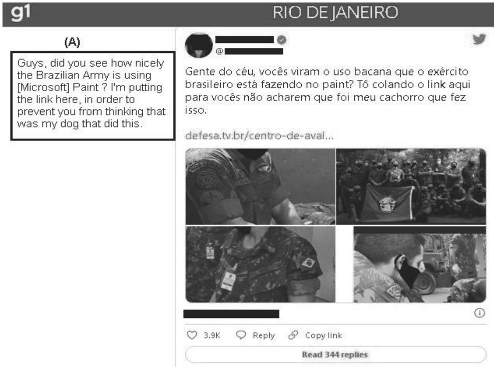
Figure 1: Textual intervention, a digital face mask as a military attribute and resonances across media spaces.