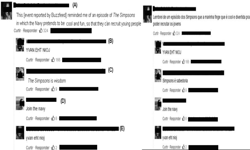
Figure 5: Interpellative dynamics, Facebook users, intercultural explorations and amplifications.

Moreover, if we take into account such ›moves‹ and the alternative pattern of orientation identified in Figure 4, the notion of self-performative and its associated potential for giving rise and sustaining orders or configurations that can communicate the military discourse through never-ending chains of ›authoritative‹ messages across media spaces would be rendered as a communicational »fallacy« 13 (Austin 1962, p. 3, 100). The latter and its relation with the notion of self-performative have become visible through resonances that pointed to a much more complex set of repertoires and practices, as Figure 5 will show: