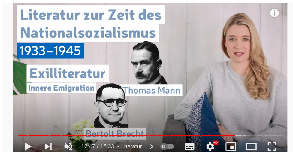
Abb. 2: Exilliteratur während des Nationalsozialismus (Screenshot aus Video 2, 12:47).