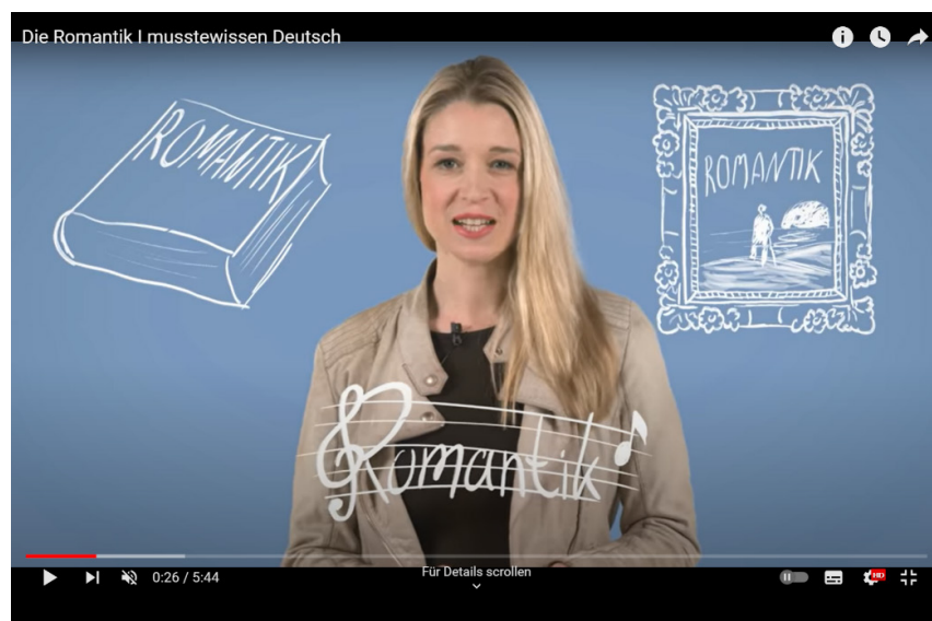
Abb. 5: Romantik in unterschiedlichen Kunstrichtungen (Screenshot aus Video 4, 00:26).

Die Nutzung von Textinserts mit Schlagworten (u.a. 05:02; 05:03; 05:30) sowie Grafikinserts (u.a. 02:34; 05:14) unterstützen das Verständnis. Ein Mensch, der zum Aufziehmännchen wird, untermalt so z.B. die Ausbeutung während der Industrialisierung (vgl. 01:56), eine Burgruine die Hinwendung der Romantik zum Mittelalter (vgl. 03:51). Gelungen ist ebenso die Analogie, die „Unendlichkeit“ als Zielpunkt romantischer Sehnsucht mit sehr langen Zugschienen vergleicht. Auch wenn sich diese in der Realität nicht berühren, tun sie dies doch in der inneren Vorstellung. Ebenso könne „Unendlichkeit“ als etwas betrachtet werden, das „zwar in der wirklichen, harten Faktenwelt nicht real sei, aber in unserem Gefühl, in unserer Seele, vielleicht doch da ist.“ (03:24-03:28)