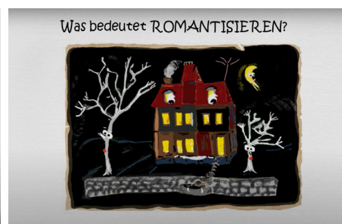
Abb. 4: Was bedeutet Romantisieren – Symbolbild für Romantisierung (Screenshot aus Video 3, 01:14).