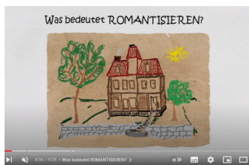
Abb. 3: Was bedeutet Romantisieren – Symbolbild Alltag (Screenshot aus Video 3, 00:50).

Die Übertragung von Novalis Forderung, „die Welt solle romantisiert werden“, missglückt. Beispielhaft wird ein gewöhnliches Haus in der Mondnacht in ein Geisterhaus verwandelt, in dem „grimmige Augen“ (01:06) aus den Fenstern blicken und die Vorgartenbepflanzung zu „leicengleiche[n] Tentakeln“ (01:09) mutiert (vgl. Abb. 3 und 4). In dem Beispiel wird jedoch gerade kein „ursprünglicher Sinn“, wie von Novalis gefordert, durch die Verwandlung herausgearbeitet, sondern nur auf der oberflächlichen Ebene aus einem Alltagsgegenstand ein mystischer Gegenstand geformt. Der Veranschaulichungsversuch verfestigt alltägliche Romantikvorstellungen anstatt die Epoche greifbar zu machen.