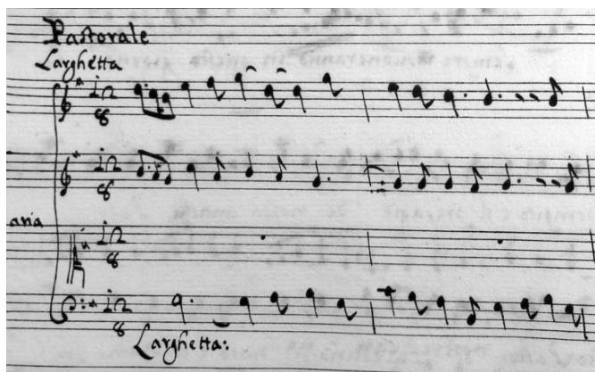
Abb. 5: Ausschnitt aus: Pastoralarie aus der Kantate Amarilli vezzosa , D-MÜs SANT Hs 759 (1713/1714)

Die in den beiden Kantaten enthaltenen Pastoralarien Sempre risuoneranno (siehe Abb. 5) und Quel Pargoletto (siehe Abb. 6) sind in ihrer musikalischen Thematik ebenfalls identisch und unterscheiden sich in den Eingangstakten nur