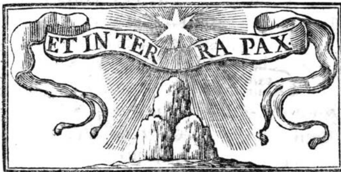
Abb. 1: Vignette mit Wappenemblem Papst Clemens XI. aus dem Libretto Vaticini di pace

Eine Zuspitzung auf die Friedensaussage erfährt Caldaras Werk überdies mit der einzigen Veränderung des Librettos von 1703: Die Schlussarie von Pace Quanto vago, quanto amato entfällt und mit ihr Paces erneut formulierte Freude über das göttliche Kind. Die Version von 1712 endet hingegen mit Amor Divinos Arie Quanto dolce, quanto cara . Diese Arie ist der Freude über den Frieden gewidmet und lässt das Stück mit den Worten Pace gradita – dem willkommenen Frieden – enden. Geschickt verwebt Gini die von der Geburt Christi ausgehende Friedensbotschaft mit dem Lob auf Papst Clemens XI., indem er Amor Divino die Worte clemente und clemenza in den Mund legt, um Pace für sich zu gewinnen. Clemenza allein solle regieren, denn nur durch sie könne der Erde Friede geschenkt werden (Su dunque la Clemenza / Regni solo e trionfi al reo condona / Et al mondo fedel, Pace ridona). Noch eindrücklicher erfolgt die Stilisierung des Papstes als Friedensbringer durch die zweimalige Referenz auf das Papstwappen des Kantatentextdruckes (siehe Abb.1):