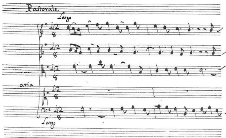
Abb. 6: Ausschnitt aus: Pastoralie aus der Kantate Vo' piangendo e sospirando , GB-Lam MS 46 (1713)

dadurch, dass Caldara in letztgenannter entsprechend der größeren Besetzung von Vo' piangendo e sospirando erneut eine Violinstimme ergänzt hat.