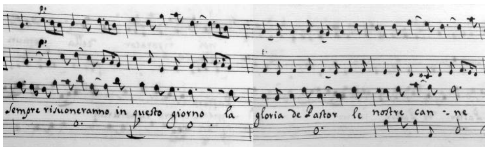
Abb. 7: Ausschnitt aus: Pastoralie aus der Kantate Amarilli vezzosa , D-MÜS SANT Hs 759 (1713/1714)

Der veränderten Schwerpunktsetzung begegnet Caldara mit auftaktigem Einsatz der Singstimme anstelle des volltaktigen Beginns in Sempre risuoneranno , der verkürzten Silbenzahl mit der Wiederholung des zweitaktigen Anfangsmotivs. Dank der Wiederholung des Wortes nascere erreicht er im letzten Vers des A-Teils ebenfalls elf Silben, was es ihm erlaubt, die Melodie der Vorlage zu übernehmen, zwar um einen halben Takt verschoben, aber in Tonhöhe und Rhythmus unverändert.