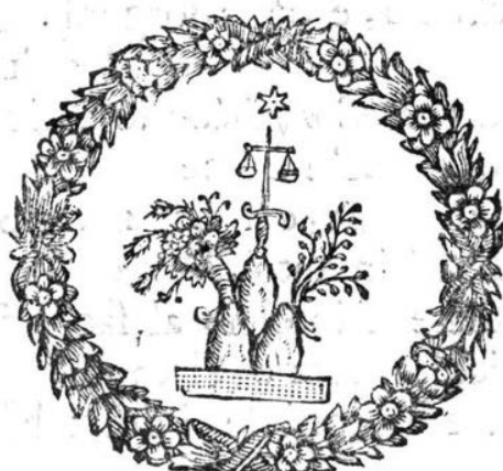
Abb. 2: Vignette mit Wappenemblem Papst Clemens XI. aus dem Libretto Vaticini di pace

Auch die äußere Form des Librettodrucks unterstützt die Aussage des Textes, indem die zentralen Worte – wie Clemente , Pace und Giustizia – durch Kapitälchen hervorgehoben und in der abschließenden Abbildung prägnant verbildlicht werden (siehe Abb. 2).