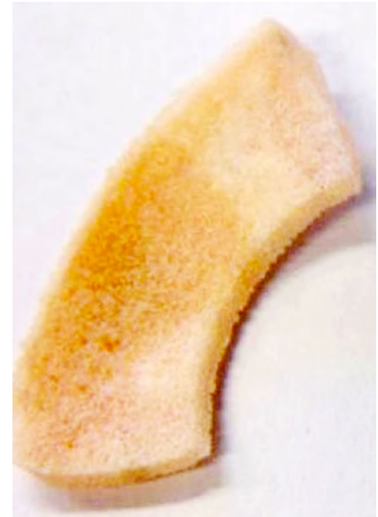
Abb. 5 ▲ Actifit-Implantat zum Meniskuserersatz. Die biomechanische Festigkeit ist höher als beim CMI. Jedoch steigt ebenfalls das Abrasionsverhalten gegenüber Knorpelgewebe

Zusammengefasst kommt es in der klinischen Anwendung von Biomaterialien mehr und mehr zu einem Paradigmenwechsel vom reinen Funktionsersatz hin zu biologischer Rekonstruktion von Geweben und Funktionen unter Hilfe dieser neuen Biomaterialien.