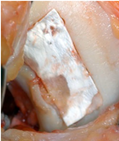
Abb. 1 ▲ Kollagen-I/III-Membran (Firma Geistlich, Schweiz) zur Besiedelung mit Zellen (autologe Chondrozytentransplantation) im Rahmen der Knorpeltherapie. Alternativ wird diese Membran auch zur AMIC-Therapie eingesetzt (Mikrofrakturierung plus Membran)