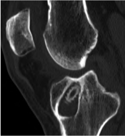
Abb. 3 ▲ Bio-Composite-Interferenzschraube (Biosure HA, Smith & Nephew) zum Kreuzbandersatz tibial. Auffällig ist die deutliche Lysezone um die Schraube, die eine Revisionschirurgie deutlich erschwert