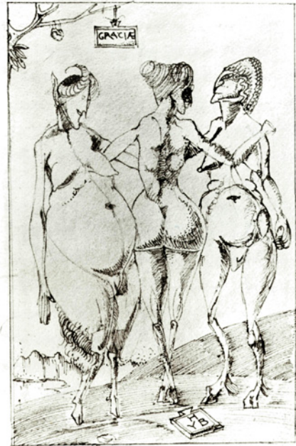
Fritz von Herzmanovskij-Orlando: „3 Grazien“. Zeichnung, Tusche. 1898

1927 wurde eine erste Herzmanovsky-Ausstellung in Berlin gezeigt – 75 Farbzeichnungen – die dem Künstler großes Lob eintrug. Seine Zeichnungen seien ein „[...] Trost in der Gleichförmigkeit der meisten Exponate“ (Presseecho). Was er beobachtet, liest, sammelt, aufsnappt und archiviert, in seinen Zeichnungen wird es bereichert und – durch den „Filter“ seiner Persönlichkeit – neu erschaffen. In seiner undatierten Feststellung „Ich habe stets getrachtet, mir einen gesunden Blick für das Irreale zu bewahren“ 12 beweist er gedankliche Verwandtschaft zu den Surrealisten. Wo aber wäre er stilistisch einzuordnen? Ist er, seinen Vorbildern nach, als ein „Präurrealist“ zu bezeichnen? Ist er, auch der zeitlichen Nähe wegen, zu den Surrealisten zu zählen? Oder gehört er vielmehr einer typisch österreichischen Subform des Surrealismus an, wie sie bis heute in den