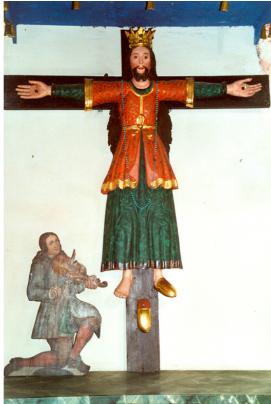
Hl. Kümmeris mit Geigerlein. Plastik, 18. Jh., in der St. Georgs-Kirche in Gerlamoos.

Ein historisch eingestellter Mensch hat einmal zu mir in der Georgskirche gesagt, man muß alles aus der Zeit heraus verstehen. Das ist gut, habe ich ihm erwidert: ‘Aus der Zeit heraus verstehen! Das können wenige .’ Ich gehe aber weiter und sage auch, habe ich zum Historiker gesagt: ‘Man muß manches als zeitlos gelten lassen. Man darf nicht alles aus der Zeit heraus verstehen, man muß auch vieles aus der Ewigkeit heraus verstehen! Und das können die wenigsten ...’ 38 – Das führt mich zum zweiten Aspekt: