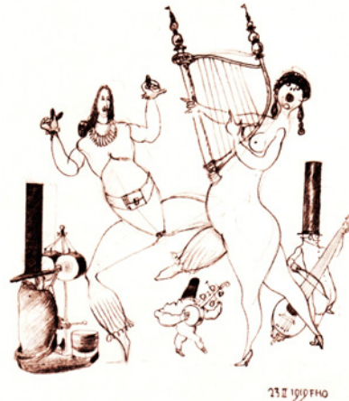
Fritz von Herzmanovsky-Orlando: „Das Tänzchen“. Zeichnung, Tusche. 1919. Galerie Welz, Salzburg

„[...] Sammeln ist mehr denn je unsere Hauptfreude und wir haben in der