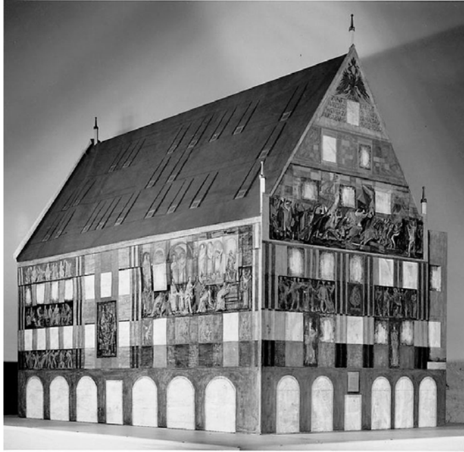
Modell des Weberhauses, Wolfgang Schmitt (Pullach)

te, die mit den Lebensaltern in Verbindung gebracht werden können. Die Westfassade kreist somit um das Thema „Spinnen und Weben“, das mittels mythologischer und biblischer Themen sowie Handelsszenen entfaltet wird. Der Bildzyklus über und unter den Fenstern im zweiten Obergeschoss der Westfassade ist dem