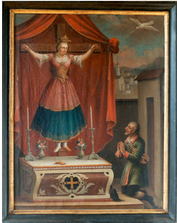
Hl. Kummernis in Rokoko-Frauentracht, ans Kreuz gefesselt, mit Geigerlein. Ölbild auf Leinwand, 18. Jh.

verbundenen Einkünfte in neue geographische Richtungen nördlich der Alpen zu lenken.“ Dahinter können politische Interessen des Hofes erkannt werden, da Maximilian „durch Eheschließung mit Maria von Burgund die Niederlande erworben hatte, aber gerne in Innsbruck residierte.“ 7 Ein Beispiel des sich in Tirol ausbreitenden Kummerniskultes befindet sich in der Kunstsammlung des Innsbrucker Stifts Wilten: Es handelt sich um ein Votivbild aus dem Jahr 1650, in dem sich ein ähnlicher Bild-Text-Kompromiss findet wie auf dem Augsburger Holzschnitt. Der unter dem Bild befindliche Text („Es war aines haidnischen Kinigs Tochter...“) – er wird bei Ignaz Vinzenz Zingerle wiedergegeben 8 – ähnelt der Version Burgkmairs in frappierender Weise; 9 nur die Verwandlung der Kummernis, über die bei Burgkmair keine näheren Details zu erfahren sind, wird hier mit deutlicheren Worten erklärt: „da verwandt Gott die Junckfrau. Und macht sie im gleich mit harr und Bart.“ Und während auf dem darüber zu sehenden Bild noch relativ eindeutig 10 ein männlicher Volto Santo-Typ zu sehen ist, wird auf später entstandenen Tiroler Kunstwerken v.a. des 18. Jh.s schon eine androgyne Gestalt in zeitgenössischer Frauentracht am Kreuz hängen, zwar mit eindeutig weiblichen Körperformen, aber zugleich mit einem abstoßenden Bart im Gesicht: „Die Kummernis