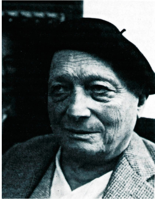
Fritz von Herzmanovsky-Orlando 1953. Eigene Bildunterschrift: „Wie sie sehen, bin ich vor Wuthundsmager geworden“.

Herzmanovsky-Orlando pflegte Kontakte zu Vielen, die in der österreichischen Literatur jener Jahre Rang und Namen besaßen. 26 Es finden sich die Namen Hofmannsthal, Friedell, Torberg und Meyrink. Fritz von Herzmanovsky-Orlando war ein Sammler. Er sammelte Anekdoten, Geschichten, Gegenstände und Ideen. Für seine dem Schwankmärchen verwandten Komödien entlieh er Figuren und Ideen