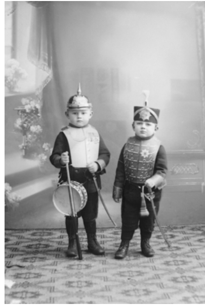
Die Söhne des Fotografen