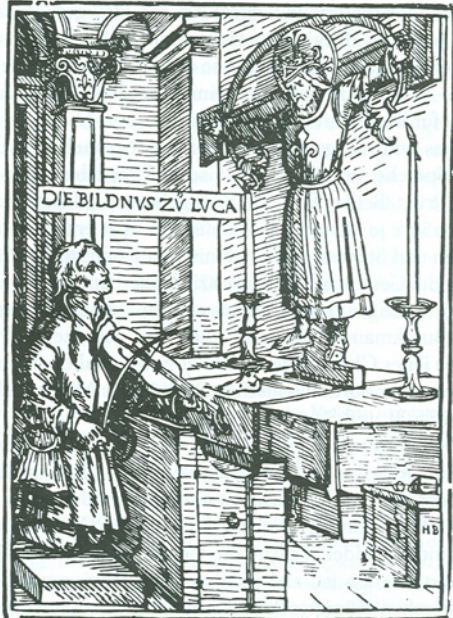
„Sanktküernerus“. Holzschnitt von Hans Burgkmair. Augsburg, um 1507.

In Bayern und Tirol war die Kümmernisverehrung ab dem 16. u. 17. Jh. weit verbreitet. Nicht zuletzt kann das darauf zurückgeführt werden, dass Hans Burgkmair als Hofkünstler Kaiser Maximilians I. (1459-1519) beflissen war, „die Verehrung der hl. Kümmernis in den habsburgischen Ländern zu verbreiten, um somit den Pilgerstrom und die damit