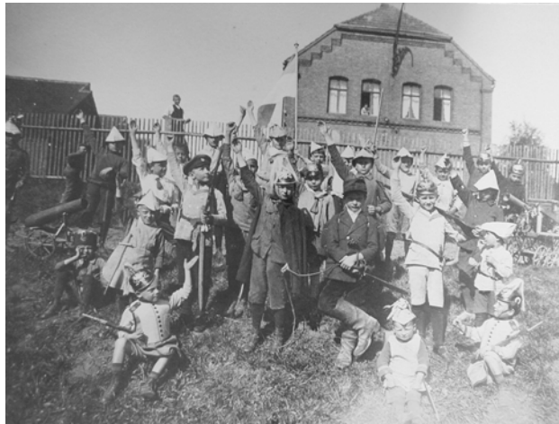
Kinder spielen Krieg

Soldat-Spielen war „in“: Die Söhne besserer Familien bekamen eigene Kinder-Säbel, -helme und -uniformen geschenkt, Kinder aus einfachen Verhältnissen behelfen sich mit hölzernen Schwertern und Papierhüten. Quasimilitärischer Drill in den Schulen war üblich. Lesestücke und Kinderverse brachten militärische Vergleiche und Themen, die Lieblingslektüre waren Heldensagen! Bei Schulfeiern wurden vaterländische Lieder geschmettert.