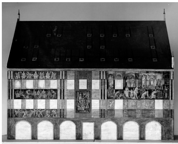
Modell des Weberhauses, Wolfgang Schmitt (Pullach)

Strenger auf die Bereiche (8) über und unter den Fensterreihen komponiert sind drei streifenartige Bildfelder im westlichen Bereich: Das unterste Intervall zeigt von links die Entdeckung des Sündenfalles, die Vertreibung von Adam und Eva aus dem Paradies und den Beginn der Menschenmühe, wobei Eva, passend zum Bildprogramm, beim Spinnen gezeigt wird. Rechteckige blaue und rote Felder unterteilen den Bildfries autonom von der Figurenkomposition. Im Intervall darüber sitzen mehrere Figuren an ihren Spinnrädern und Webstühlen. Eine Person ganz rechts ist mit einem Gefäß herangeeilt, das mit den fertigen Stoffen gefüllt wird. Auch die drei heller farbigen Figuren im obersten Bildfeld sind mit Spinnen beschäftigt: Es sind die Nornen, die den Lebensfaden der Menschen spinnen. Vier weitere Figuren, die fast mit den roten Rechtecksfeldern ihrer Umgebung verschmelzen, wenden sich den Nornen zu: Eine Figur präsentiert Trauben, eine andere einen Blumenstrauß – Attribu-