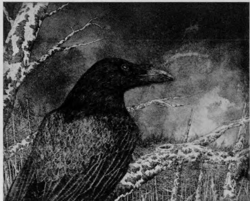
Stefan Feigl: „Rabe“, 500 x 400 mm; Strichätzung/Aquatinta, 2003

München und die Bayerische Staatsbibliothek arbeitete das Unternehmen ebenso wie nun wieder für das bayerische Kultusministerium und das Münchner Kulturreferat. In der GloorWerkstatt werden in Seminaren für die FH München, die Berufsfachschule für Kommunikationsdesign und die Fachakademie US graphische und typographische Grundlagen vermittelt.