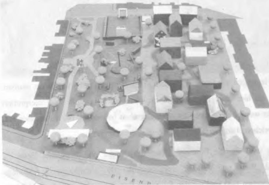
Abb. 5 Modell Gruppe 1