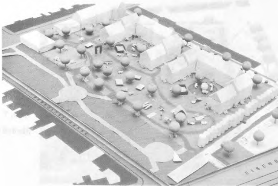
Abb. 10 Modell Gruppe 6