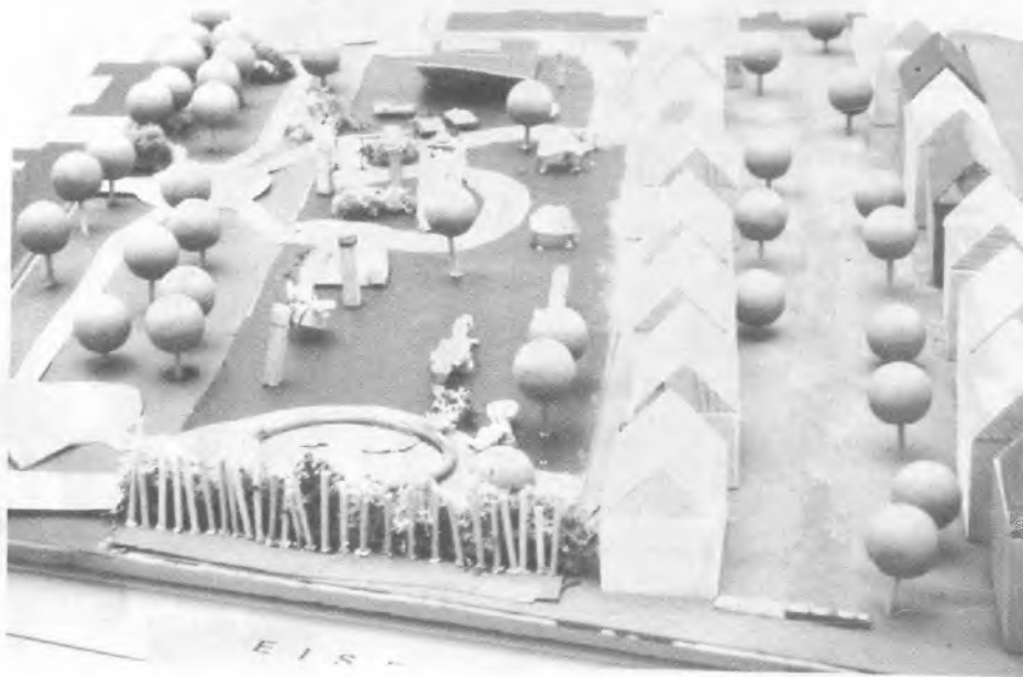
Abb. 11 Modell Gruppe 7