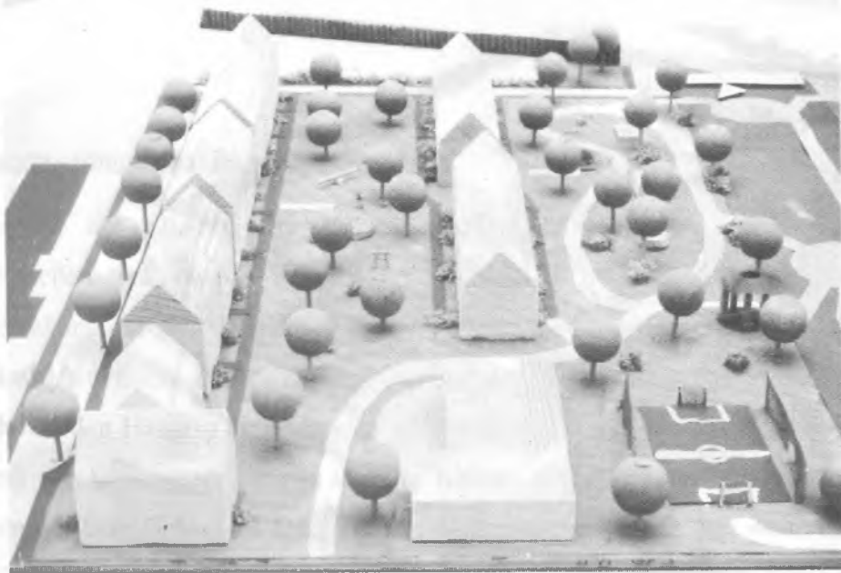
Abb. 7 Modell Gruppe 3