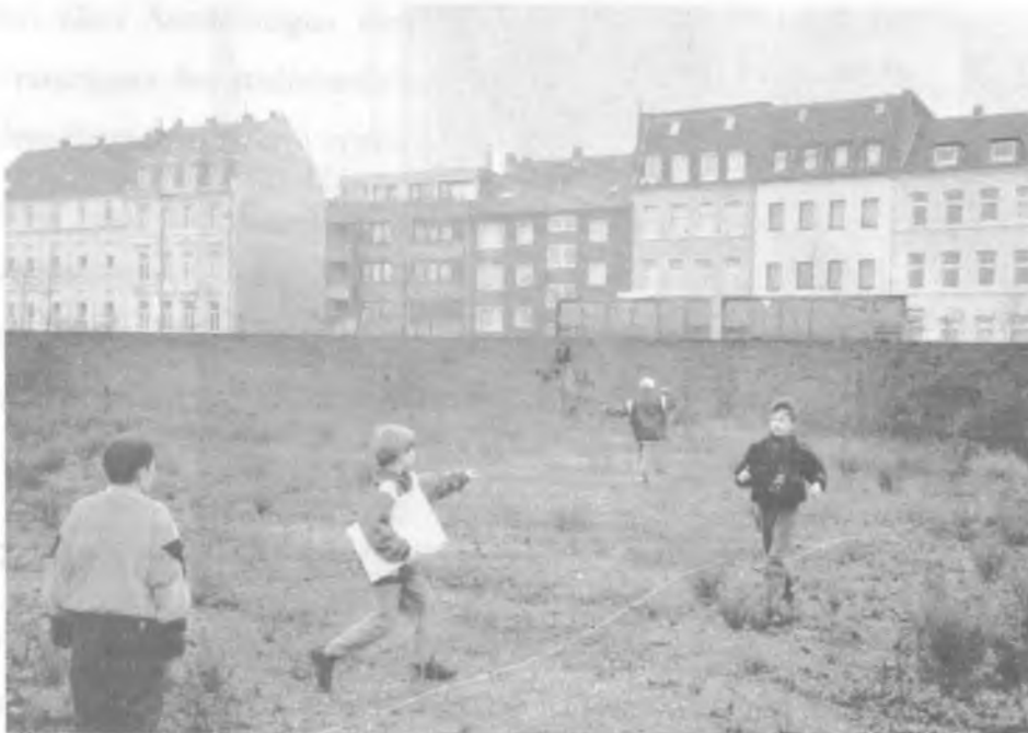
Abb. 3: Phase II, Vermessen des Geländes auf Streifzügen

Planunterlage (M. 1:500), die jedoch auf den Maßstab 1:200 vergrößert worden war, um das bequeme Arbeiten von 5-6 Kindern an einem Modell zu ermöglichen und die Gestaltung der Planungselemente zu erleichtern.