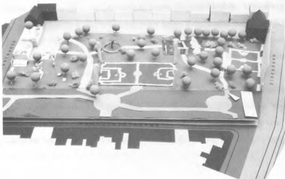
Abb. 6 Modell Gruppe 2