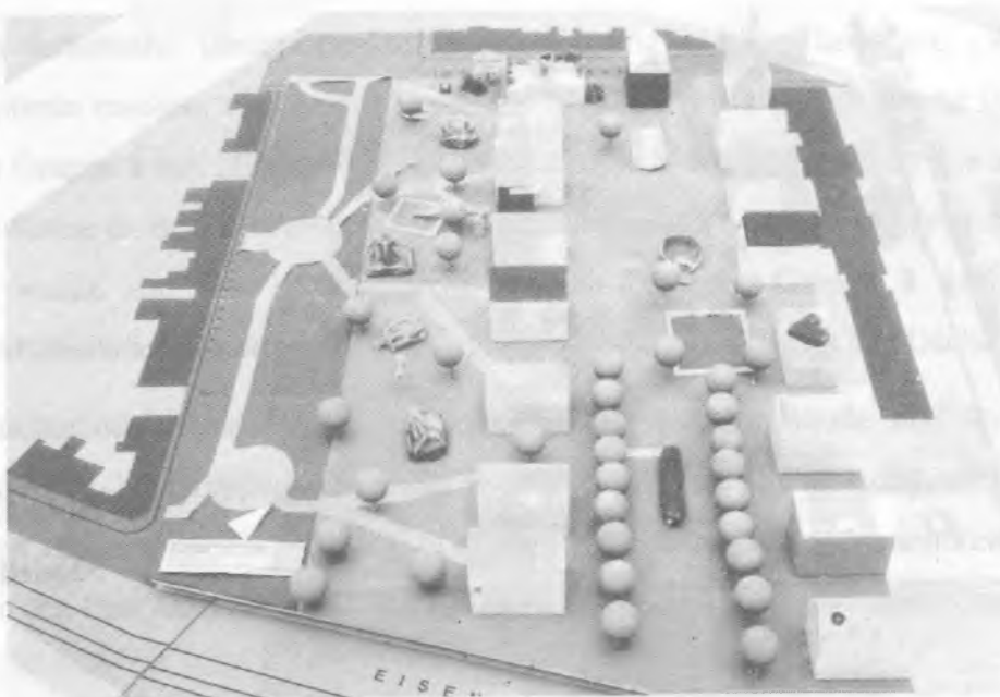
Abb. 9 Modell Gruppe 5