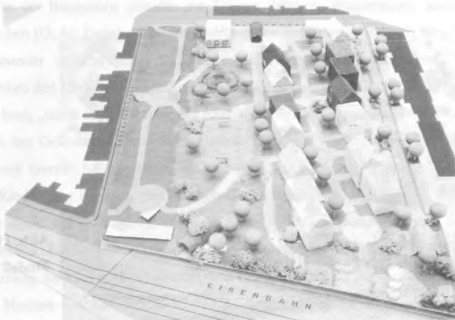
Abb. 8 Modell Gruppe 4