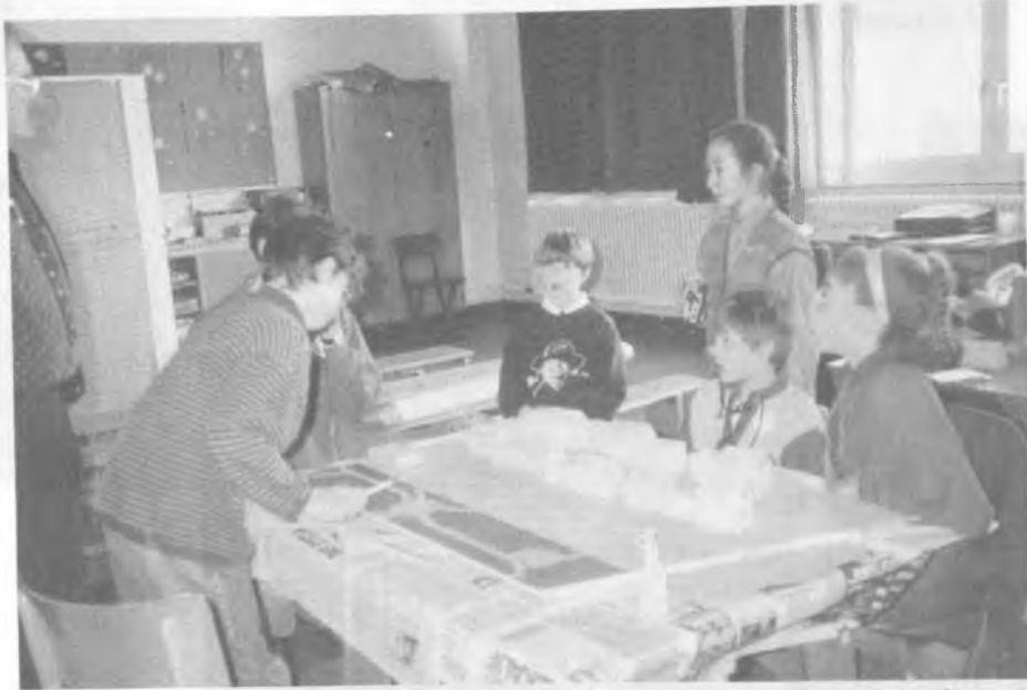
Abb. 4: Phase III, Modellbau

ihrer Planungen faßten die Kinder anschließend in Erläuterungsberichten zu den einzelnen Gruppenmodellen zusammen.