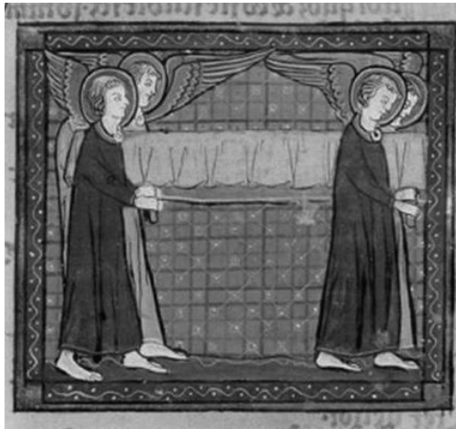
Abb. 7: Remigius, Translatio, San Marino (Calif.), Huntington Library, Cod. HM 3027, 137 va