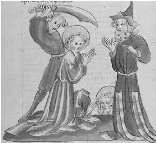
Abb. 11: Gervasius and Prothasius, Diebold Lauber Werkstatt, Augsburg, Staats- und Stadtbibliothek, 2° Cod. 158, 301 v