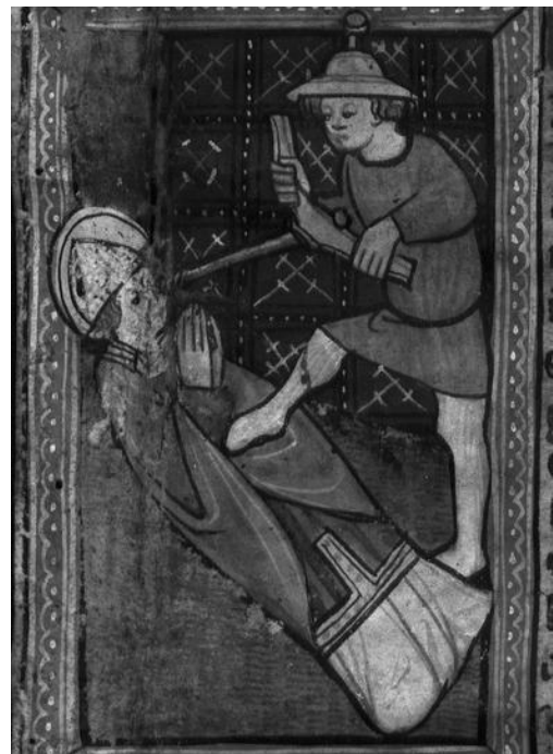
Abb. 6b: Leodegarius, Wiesbaden, Hauptstaatsarchiv, Abt. 3004 Nr. A 152