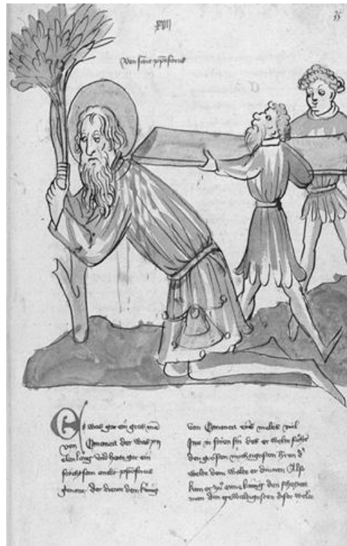
Abb. 9: Christophorus, Straßburger Werkstatt von 1418, Heidelberg, Universitätsbibl., cpg 144, 35 r

In inem Werbebrief bietet er ca. 40 Werke an, geistliche und weltliche, gemolt und ohne Bilder. Es werden aber noch mehr gewesen sein. Überliefert sind 65 illustrierte und 4 reine Texthandschriften, wobei die Bebilderung künstlerisch und qualitativ wesentlich besser ist als die der Werkstatt von 1418. Dass Laubers Betrieb fast 50 Jahre produktiv war, wenn auch mit wechselnden Organisationsformen, unterschiedlicher Aktivität und immer neuem Personal, zeugt von einem zweifellos sehr erfolgreichen Geschäftsmodell. Wie beim Organisator der ‚Werkstatt von 1418‘ dürfte sich Laubers Rolle in dem Betrieb vorwiegend auf die Beschaffung von Papier, wie auch im Einzelfall Pergament, das Anheuern von Schreibern und Malern, die Besorgung von Vorlagen (nach Möglichkeit Handschriften mit ausgefeiltem Bildprogramm) sowie den Vertrieb der Bücher beschränkt haben, denn an nur wenigen Handschriften war er offenbar als Schreiber selber beteiligt. Mit