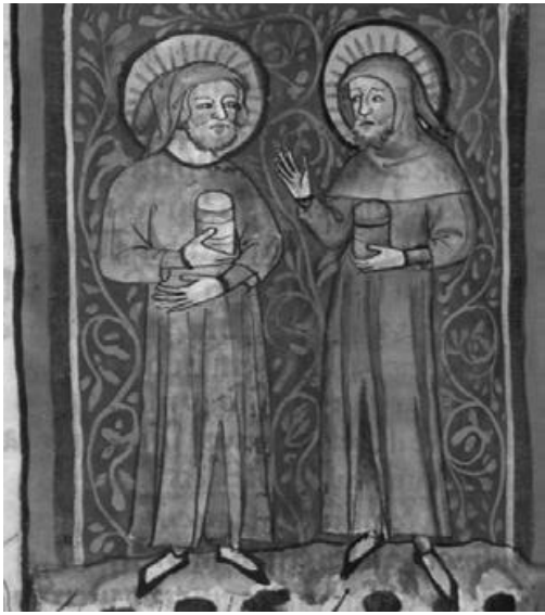
Abb. 3a: Cosmas and Damian, München, München, Bayerische Staatsbibl., cgm 6, 164 vb