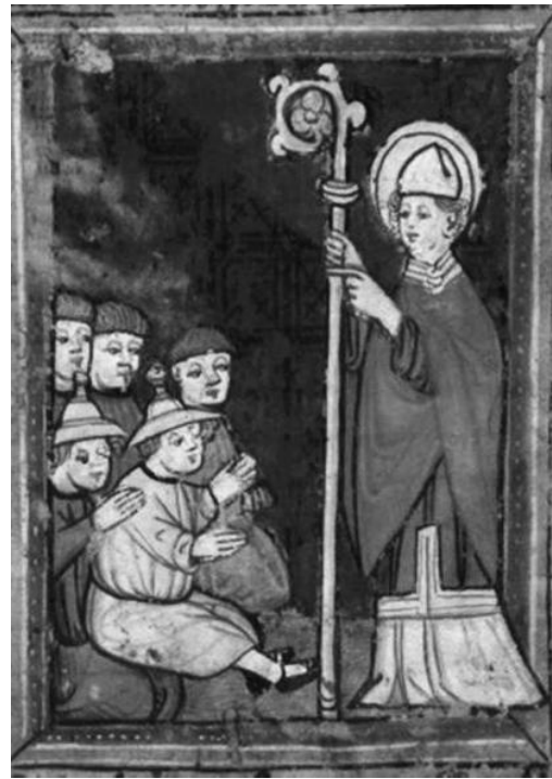
Abb. 5b: Remigius, Translatio, Wiesbaden, Hauptstaatsarchiv, Abt. 3004 Nr. A 152