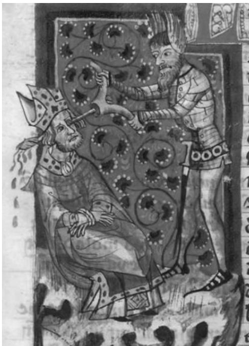
Abb. 6a: Leodegarius, München, Bayerische Staatsbibl., cgm 6, 171 ra