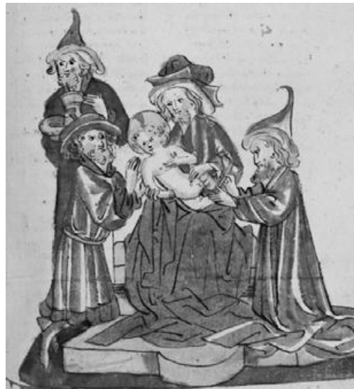
Abb. 10: Beschneidung Christi, Diebold Lauber Werkstatt, Berlin, Staatbibl. zu Berlin, Preußischer Kulturbesitz, mgf 495, 50 r

Stark typisiert sind auch bei Lauber die vielen üblichen Darstellungen von der Exekution von Märtyrern. Ein Scherge holt mit seinem Schwert aus, der Märtyrer kniet vor ihm zum Gebet mit gefalteten Händen. Anwesend ist auch der Richter, bisweilen mit einem Helfer. Dieses Bildmuster wird immer wieder bedenkenlos verwertet. So wird das Martyrium von Gervasius und Prothasius gestaltet, wenn auch wieder nicht genau der Handlung der Legende folgend, denn Gervasius, dessen abgeschlagener Schädel bereits am Boden liegt, während seine Hände