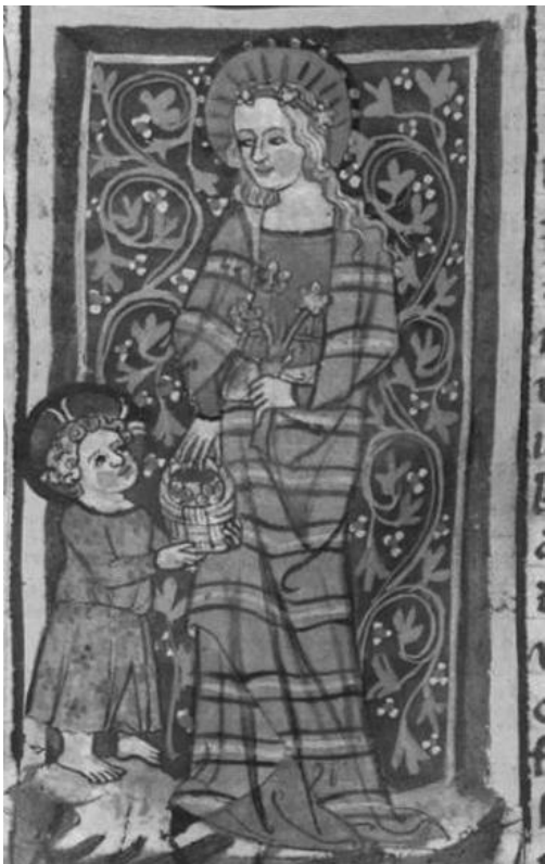
Abb. 4a: Dorothea, München, Bayerische Staatsbibl., cgm 6, 168 rb