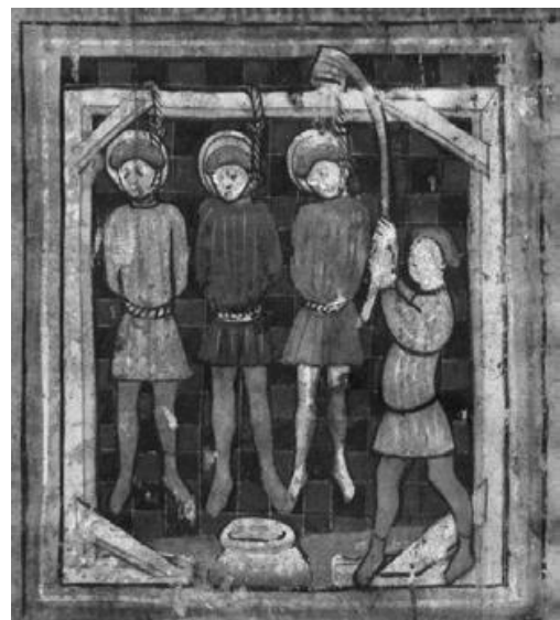
Abb. 2b: Cyriacus, Wiesbaden, Hauptstaatsarchiv, Abt. 3004 Nr. A 152