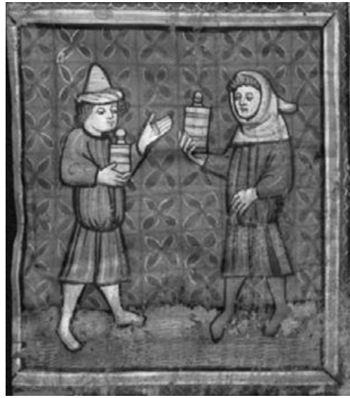
Abb. 3b: Cosmas and Damian, Wiesbaden, Hauptstaatsarchiv, Abt. 3004 Nr. A 152