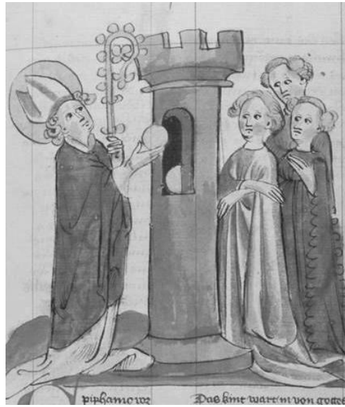
Abb. 13: Nikolaus, Diebold Lauber Werkstatt, Augsburg, Staats- und Stadtbibliothek, 2° Cod. 158, 21 r

nen nun obligatorisch. Die Drucke versuchten dann auch mit z. T. aufwendig gemalten Initialen und Kolorierung der Holzschnitte den Eindruck von Prachthandschriften zu vermitteln. Man konkurrierte sogar auf der Grundlage der Bebilderung, auf deren Besonderheit auf den Titelblättern häufig aufmerksam gemacht wurde, besonders heftig. 38 Zwar waren die gedruckten Legendare aufgrund ihres Umfangs auch nicht sonderlich preisgünstig, aber sie wurden im Vergleich zu illustrierten Handschriften nun endlich doch auch für einen wesentlich größeren Kundenkreis erschwinglich.