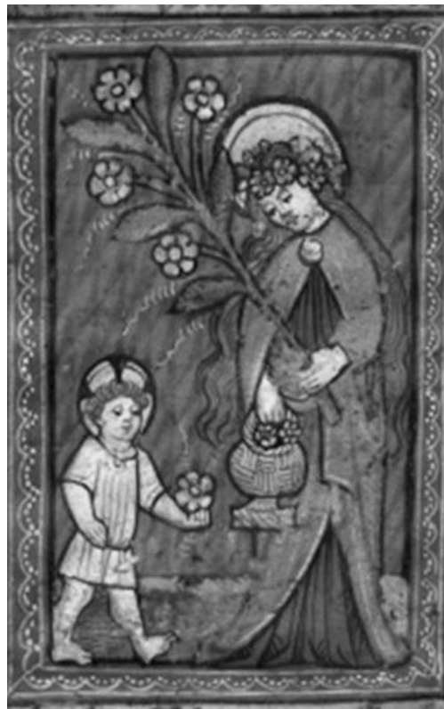
Abb. 4b: Dorothea, Wiesbaden, Hauptstaatsarchiv, Abt. 3004 Nr. A 152