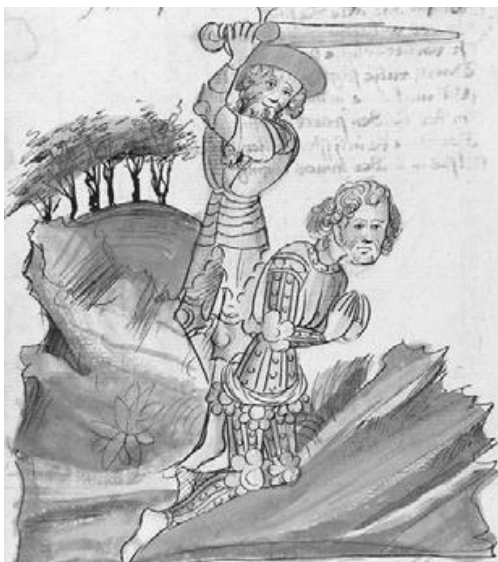
Abb. 12: ‚Die Virginal‘, Heidelberg, Universitätsbibliothek, cpg 324, 14 v

noch beten, wurde nach der ‚Legenda aurea‘ mit Bleiklötzen getötet, wie es etwa in dem französischen Legendar aus der Montbaston-Werkstatt korrekt dargestellt wird (Abb.11). Gelegentlich machen es sich Laubers Illustratoren aber doch etwas zu einfach. Das berühmte Beispiel aus einer Handschrift mit der Heldenichtung ‚Die Virginal‘, einem der Heldenepen um Dietrich von Bern, zeigt, wie Hildebrand einem knien und betenden Heiden nach langem schwerem Kampf den Kopf abschlägt (Abb. 12). Dafür stand ein bequemes hagiographisches Bildmuster zur Verfügung, das selbstverständlich mit dem Text absolut nichts zu tun hat.