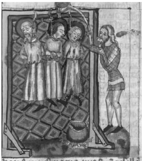
Abb. 2a: Cyriacus, München, Bayerische Staatsbibl., cgm 6, 136 tb

schrift Wiesbaden, Hauptstaatsarchiv, Abt. 3004 Nr. A 152, illustrieren die Legenden von Cyriacus, Cosmas und Damian, Dorothea, Translatio des Remigius und Leodegarius, wobei das Fragment der Cyriacus-Legende aus einem wesentlich früheren Teil der ursprünglichen Handschrift stammt. Obwohl von geringerer künstlerischer Qualität, ähneln die Miniaturen ihren Entsprechungen im Cgm 6 auf verblüffende Weise (Abb. 2–6). Vor allem das Remigius-Bild ist dabei von besonderem Interesse. Denn der Heilige predigt hier, was durchaus auch zum Text der ‚Legenda aurea‘ passt, zumal Remigius als Apostel der Franken die fränkischen Anhänger des Arianismus bekehrte. In Jacobus’ Legende wird von der translatio erst ganz am Ende erzählt, vorher ist Remigius noch durchaus aktiv und wirkt auch Wunder. Allerdings zeigt die Miniatur, wie Remigius auch vor Juden predigt, die durch den typischen Judenhut zu erkennen sind; sie ersetzen also Häretiker lang vergangener Zeiten. In der oben erwähnten lateinischen ‚Legenda aurea‘-Handschrift passt das Bild eher zu seiner Translatio , indem dort die processio dargestellt wird (Abb. 7).