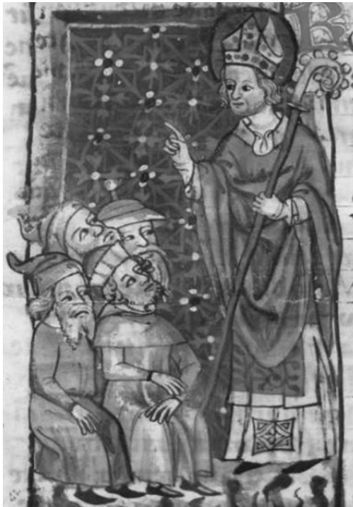
Abb. 5a: Remigius, Translatio, München, Bayerische Staatsbibl., cgm 6, 170 va