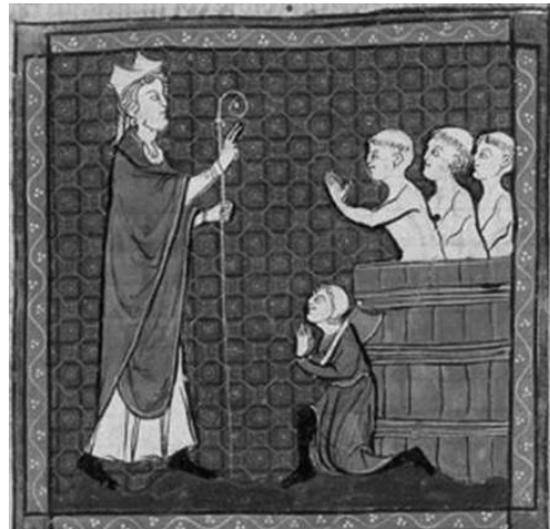
Abb. 1: Nikolaus, San Marino (Calif.), Huntington Library, Cod. HM 3027, 3 ra

der Handschrift der oben erwähnten lateinischen ‚Legenda aurea‘ (3 r ) wie in jeder Handschrift der ‚Légende dorée‘ außer in Paris, Bibliothèque Nationale MS fr. 244–5 (ca. 1480), wo die Goldklumpenszene zu finden ist, wird Nikolaus als Retter dreier Scholaren dargestellt, die von einem Fleischer ermordet, zerstückelt und in einem Salzfass eingepökelt wurden und die der Heilige wieder zum Leben zu erwecken vermochte (Abb. 1). Dieses Mirakel findet sich allerdings nicht in der ‚Legenda aurea‘.