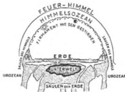
Abb.: Antikes Weltbild

für Himmel nur ein Wort kennt, kann Himmel leicht als räumliche Kategorie im Sinne von Firmament verstanden werden. Demgegenüber unterscheidet beispielsweise das Englische zwischen heaven ( Himmel als transzendenter innerweltlicher sowie religiöser Kategorie ) und sky ( Himmel im Sinne von Firmament ). Auch wenn das antike Weltbild den Himmel „oben“ , über der Erde und dem Firmament ansiedelt, geschieht das im Bewusstsein, dass darin die besondere Nähe zu Gott zum Ausdruck kommt. 2 Es stellt sich die Frage, ob und wie dieses „Bei-Gott-Sein“ anderweitig ausgesagt werden kann, und zwar für heutiges Sprachempfinden angemessen und verständlich.