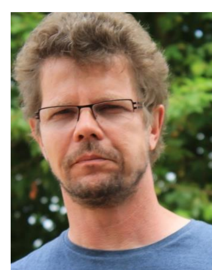
Dr. Martin Scholz Sportzentrum