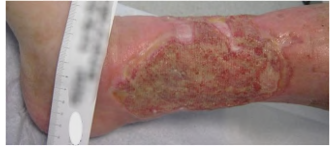
Abb. 2 ▲ Pyoderma gangraenosum in Remission mit Gulliver-Zeichen

In etwa 50% der Fälle findet sich bei betroffenen Patienten eine Assoziation mit anderen Erkrankungen. Am häufigsten sind hierbei Diabetes mellitus (25,1%), chronisch entzündliche Darmkrankungen (CED wie Morbus Crohn, Colitis ulcerosa, 34%), rheumatoide Arthritis (29%) und hämatologische Neoplasien (20%) [3, 15]. Des Weiteren sind seltenere Komorbiditäten wie Hepatitiden, primär biliäre Zirrhose und systemischer Lupus erythematodes beschrieben, wobei die Häufigkeit der assoziierten Erkrankungen je nach Subtyp des PG stark variiert