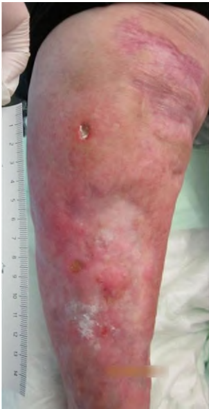
Abb. 3 ▲ Narbenbildung nach Pyoderma gangraenosum, Pathergiephänomen nach Kratzwunde (oben)

Die Diagnose muss durch den Ausschluss der Differenzialdiagnosen erfolgen [1].