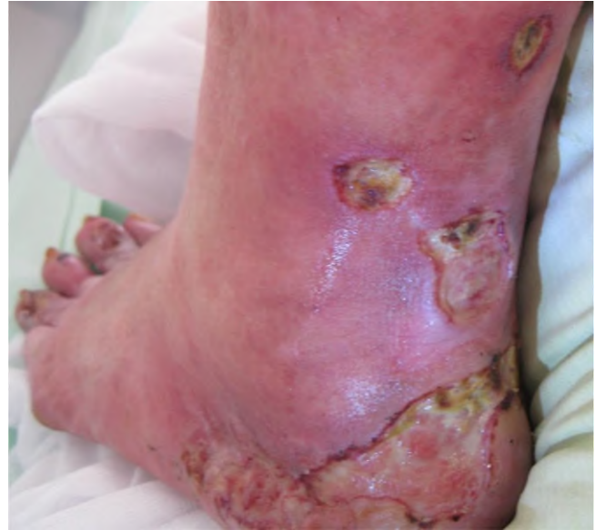
Abb. 6 ▲ Ulzerierte Knoten bei nodöser Vaskulitis

Das Ulcus cruris venosum und arteriosum betrifft typischerweise bestimmte Lokalisationen wie Ischämiezonen beim arteriellen Ulcus sowie distale Insuffizienzpunkte bei venösen Ulzera. Das Pyoderma gangraenosum hingegen kann an allen Lokalisationen auftreten, wobei Manifestationen an den Unterschenkeln häufig sind, da hier Traumata und zusätzliche Faktoren wie Stase das Auftreten begünstigen. In der Umgebung venöser Ulzera findet sich nahezu immer eine Dermato(lipo-)sklerose und oft eine Purpura jaune d'ocre, während das Pyoderma gangraenosum auf unveränderter Haut auftritt. Ein weiteres klinisches Unterscheidungsmerkmal ist der Ulkusrand, der beim akuten Pyoderma aufgeworfen