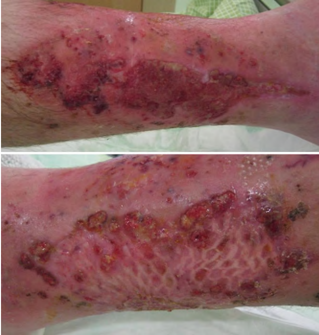
Abb. 1 ▲ Akutes Pyoderma gangraenosum mit multilokulären bizarren Ulzera, Nekrosen und Pusteln an beiden Unterschenkeln. Im Randbereich der Spalthauttransplantation erscheinen neue Herde als Pathergiephänom

Minimaltraumata können diese auslösen oder aggravieren (s. Pathergiephänomen unten), dazu zählen auch iatrogene Verletzungen der Hautintegrität (■ Abb. 1 ). Die Ulzera sind primär steril, können aber bei längerer Bestandsdauer eine mikrobielle Kontamination aufweisen. Im akuten Stadium weisen die Ulzera die beschriebene typische Morphologie auf. Wenn sie allerdings länger bestehen und die entzündliche Aktivität – auch durch eine Therapie – abgeklungen ist, kann das PG sehr unspezifisch aussehen, sodass es von Ulzera anderer Genese kaum noch unterschieden werden kann. Das PG kann an den Unterschenkeln auftreten, häufig sind aber auch atypische Lokalisationen wie Bauch oder Brustbereich.