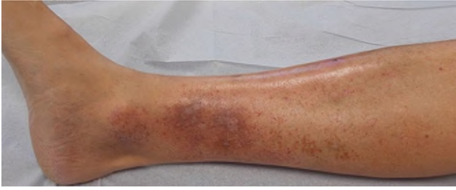
Abb. 5 ▲ Livedovaskulopathie mit bizarren Narben (Capillaritis alba)

na benigna gehört somit zum Formenkreis der nodösen Vaskulitiden.