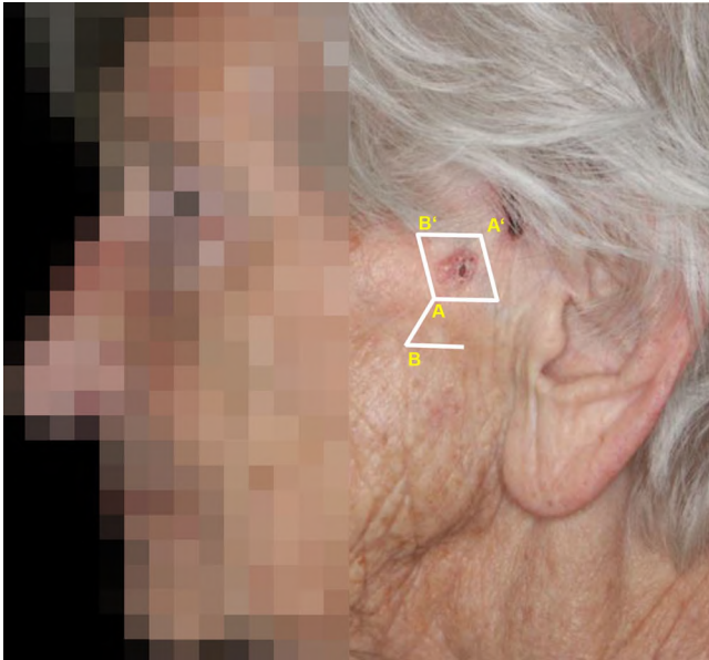
Abb. 6 ◀ Transpositionsflappen, rhomboides Design