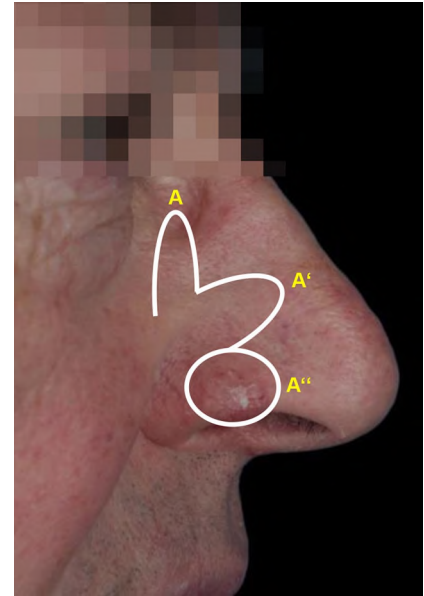
Abb. 7 ▲ Transpositionslappen, „bilobed flap design“