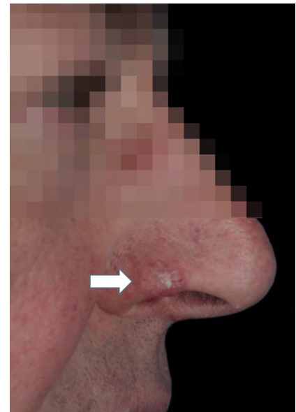
Abb. 2 ▲ Hautveränderung an der Nase, 65-jähriger Patient