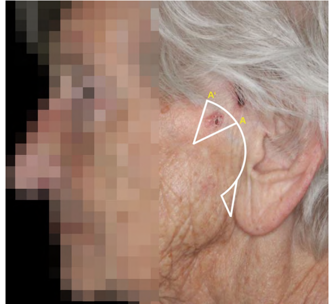
Abb. 5 ▲ Rotationslappen

funktionell optimalen und gleichzeitig ästhetischen Defektverschlusses ist die individuelle Lösungsfindung für jeden Defekt. Die resultierenden Narben kommen hierbei auf den Grenzen der Gesichtsfelder oder entlang der RST-Linien zu liegen.