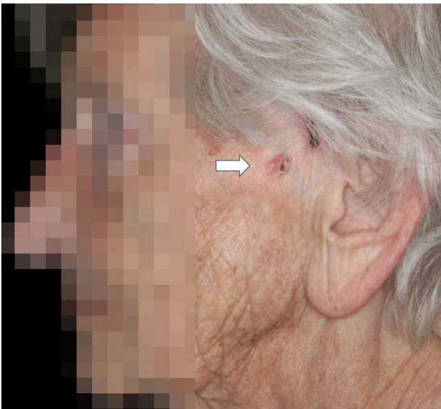
Abb. 1 ◀ Hautveränderung präaurikulär, 85-jährige Patientin