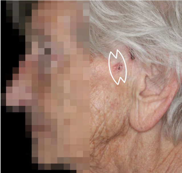
Abb. 4 ▲ Ellipsoide Exzision mit M-Plastik und V-Y-Wundverschluss