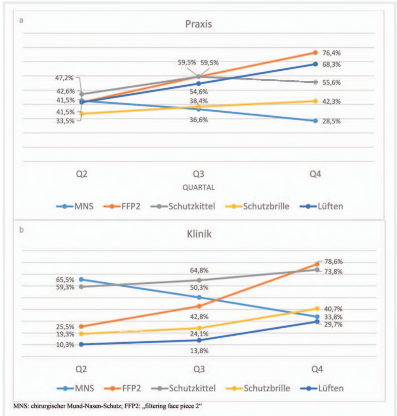
► Abb. 1 Einsatz der persönlichen Schutzausrüstung im Verlauf der Pandemie über alle befragten Einrichtungen für Praxen a und Kliniken b . FFP2: „filtering face piece 2“; MNS: chirurgischer Mund-Nasen-Schutz; Q2: Quartal 2/2020; Q3: Quartal 3/2020; Q4: Quartal 4/2020; * *: p < 0,01 . MNS: chirurgischer Mund-Nasen-Schutz; FFP2: „filtering face piece 2“.

Bezüglich des Mitarbeiterscreenings gaben sowohl 70,5% ( n = 198 ) Praxen als auch 75,2% ( n = 109 ) Kliniken an, ihre Mitarbeiter ohne Anlass getestet zu haben (siehe ► Tab. 2 ). Die überwiegend verwendete Testmethode in den Praxen war ein Antigen-test 70,7% ( n = 140 ). In den Kliniken kamen Antigentests (34,9%; n = 38 ) signifikant seltener zum Einsatz ( p < 0,00 ), wohingegen