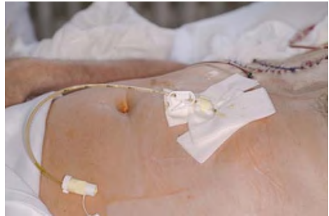
Abb. 4 ▲ Perkutane endoskopische Gastrostomie. Hautschutz durch Kompressen