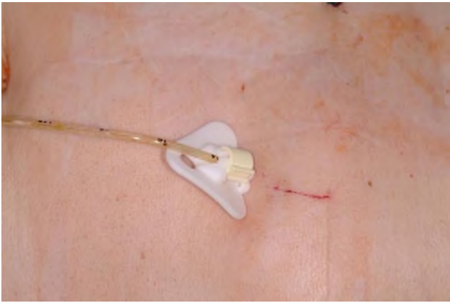
Abb. 3 ▲ Perkutane endoskopische Gastrostomie