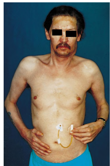
Abb. 1 ▲ Patient mit liegender PEG-Sonde

Vor einer geplanten PEG-Anlage wurden die Patienten zur strikten Nahrungskarenz ab 22 Uhr des Vortages angehalten. Das Trinken kleiner Flüssigkeitsmengen war erforderlichenfalls erlaubt, was von Patienten, die während oder nach Strahlentherapie unter häufig quälender Mundtrockenheit litten, als äußerst angenehm empfunden wurde. Eine gründliche Mund- und Rachenhygiene mit Desinfizienzien und Adstringentien wurde durchgeführt, um die Keimzahl im Mund-Rachenraum zu reduzieren.