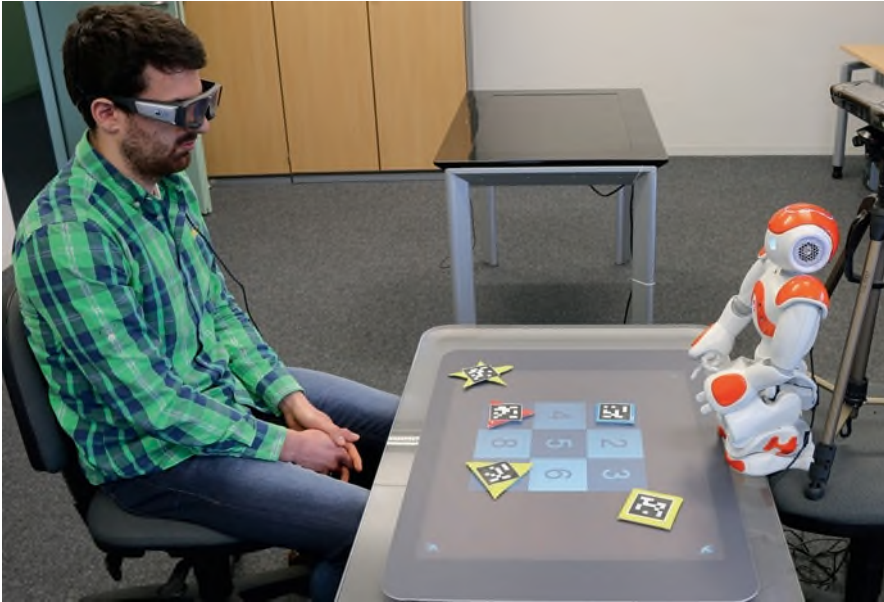
Abb. 15.2 Blickkontakt zwischen Nutzer und Roboter