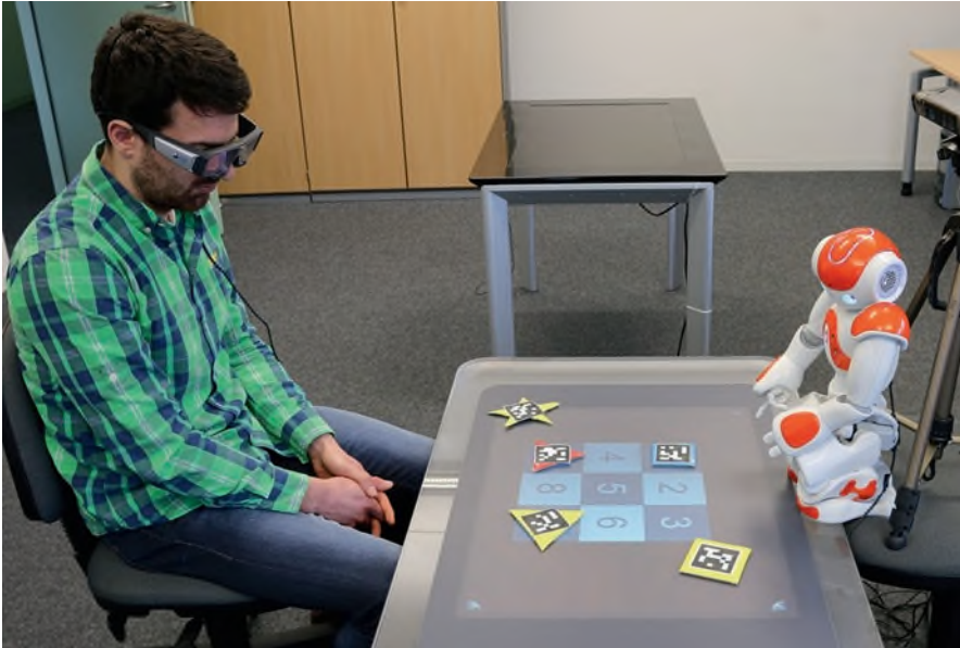
Abb. 15.1 Aufmerksamkeit von Nutzer und Roboter liegen auf dem gleichen Objekt

Viele der dafür notwendigen Bestätigungen finden auf der nichtverbalen Ebene statt. Kurze Signale wie Kopfnicken (Clark und Brennan 1991), Blickkontakt (Argyle und Graham 1976; Clark und Brennan 1991) und der Blick auf relevante Objekte in der Umgebung (Argyle und Graham 1976) zeigen (s. Abb. 15.1 und 15.2), ob der Zuhörer aufmerksam ist und den Sprecher verstanden hat. Sprache wird oft mit Handgesten kombiniert, um möglichst effizient eine unmissverständliche Aussage zu treffen (Clark und Krych 2003; Kendon 2004; van der Sluis und Kraemer 2007).