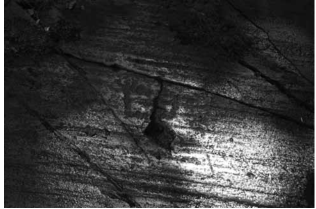
Fig. 2 – Grandi mani con busto ricavato da una frattura. Ronchi di Zir, roccia 76 sett. B..