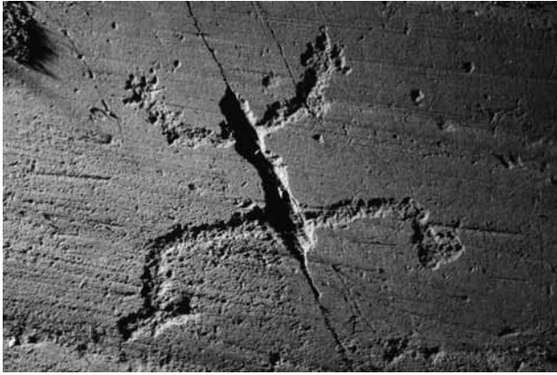
Fig. 3 – Orante con busto ricavato da una frattura. Campanine di Cimbergo, roccia 50 sett. E. (foto Dip. CCSP).