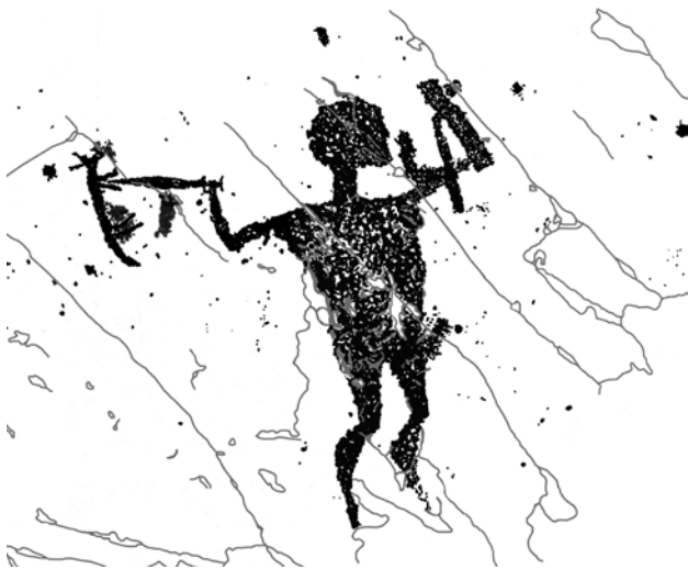
Fig. 4 – Grande armato che emerge da una frattura: b) rilievo. Campanine di Cimbergo, roccia 50 sett. E. (Dip. CCSP).