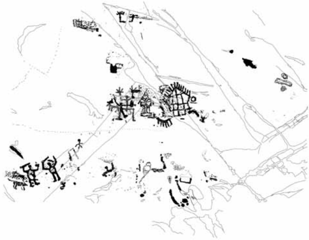
Fig. 1 – Ronchi Di Zir, roccia 76 sett. B. Ricomposizione digitale dei rilievi (Dip. CCSP).