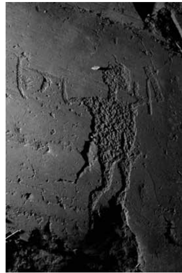
Fig. 4 – Grande armato che emerge da una frattura: a) fotografia. Campanine di Cimbergo, roccia 50 sett. E.