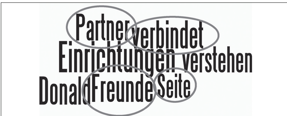
Abbildung 4: Kollokationen für die Wortstämme Vereinigten Staaten(von Amerika)|USA|amerik* in der zweiten Phase

Die in der ersten Phase bereits auftretenden Zeichen enttäuschter Liebe sind in der zweiten Phase, in der die Streitigkeiten um einen Militäreinsatz im Irak ihren Höhepunkt erreichten, deutlicher zu erkennen. Mehr noch: Hier wandelte sich die Enttäuschung des Strebens nach produktiver Liebe in Machtbestrebungen gegen das US-amerikanische Andere. Dies geschah jedoch in einer sanften Form, welche die Freundschaft zwar nicht aufkündigte, aber dennoch auf ihre Beschädigung hindeutete. Auf der Ebene sprachlicher Regularien zeigt sich dies, wenn auch nur relativ schwach. Da Schlüsselwörter die statistische Signifikanz eines Wortes innerhalb eines Subkorpus im Vergleich zu einem anderen wiedergeben, bedeutet die Tatsache, dass SOLIDARITÄT ein Schlüsselwort für die erste Phase ist, auch, dass es keines für die zweite Phase ist. Auch eine Kollokationsanalyse bringt den Begriff Solidarität, wie Abbildung 4 verdeutlicht, nicht mehr als statistisch signifikanten Kollokator für die Beschreibungen des US-amerikanischen Anderen hervor, der aber immer noch als PARTNER und als FREUND[] wahrgenommen wurde, mit dem Deutschland etwas VERBINDET und zumindest in Sachen Afghanistan auf einer SEITE steht.