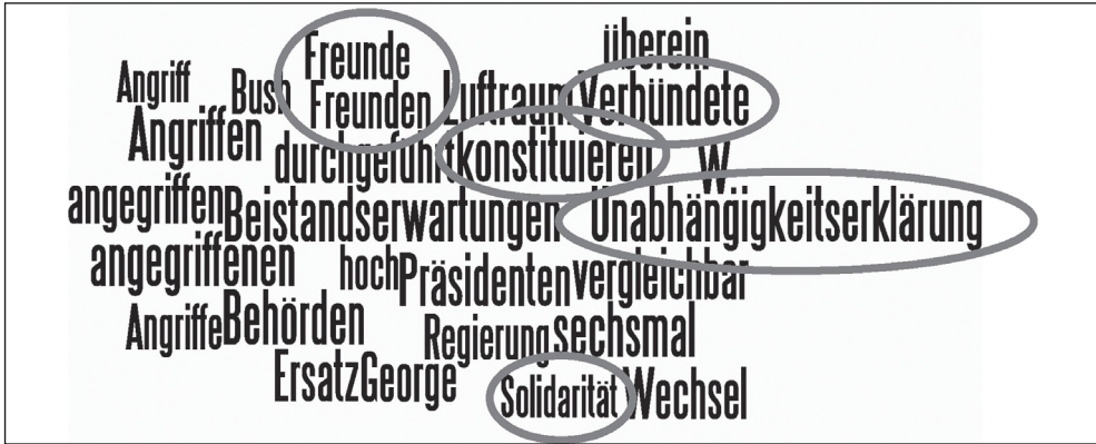
Abbildung 3: Kollokationen für die Wortstämme Vereinigte Staaten(von Amerika)|USA|amerik* in der ersten Phase

keitserklärung die gleiche Wertebasis und deshalb seien »die Angriffe auf die Vereinigten Staaten von Amerika, nicht nur Angriffe auf die Werte [...], nach denen sich die Amerikaner politisch konstituieren, sondern auch Angriffe auf jene Werte, die für uns politisch konstitutiv sind.«