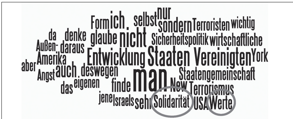
Abbildung 2: Schlüsselwörter in der ersten Phase des deutschen Diskurses 20

tierung an kollektiven Anliegen und Handlungen (vgl. Honohan 2008, S. 69) und somit auf eine liebevolle Orientierung. »Solidarity relations [...] are the political form or social form of love relations« (Lynch 2014, S. 186, Fn 2). Seine Wirkungskraft erhält das Wort nicht nur durch die abstrakte Form, die mehrere Bedeutungsgebungen ermöglicht (vgl. Naber 2005, S. 105), sondern auch durch die in ihm zum Ausdruck kommende Emotionalität (vgl. Koschut 2014, S. 542) und das Streben nach Liebe. Die Verbindung zwischen deutschem Selbst und US-amerikanischem Anderen wurde durch den Verweis auf gemeinsame WERTE hergestellt, wobei eine Feinanalyse für die dabei angesprochenen Werte zeigt, dass SOLIDARITÄT selbst als ein solcher gemeinsamer Wert genannt wurde: »Darum betone ich noch einmal, dass wir im Kampf gegen den Terrorismus die Werte von Freiheit, Solidarität und Gerechtigkeit um keinen Millimeter preisgeben dürfen« (Schröder 2001a).