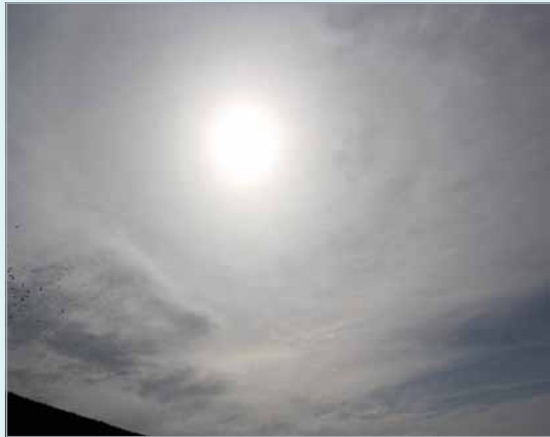
Staubereignis: Saharastaub trübt den Himmel

resultiert aus der größeren Erwärmung der extremen Minimumtemperaturen im Winter im Vergleich zu den extremen Maximumtemperaturen im Sommer. Andere Regionen des Mittelmeerraums zeigen hingegen ein eher gemischtes Bild der Veränderungen. Für Teile der Iberischen Halbinsel könnten sich sogar geringfügige Rückgänge bei den betrachteten Perzentilwerten ergeben.